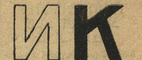
№ 10. ДВЕ БУКВЫ.

На рисунке число — 188. Нужно разделить его на две части, чтобы затем, сложив обе полученные части, получить новое число — 200. Как это сделать?