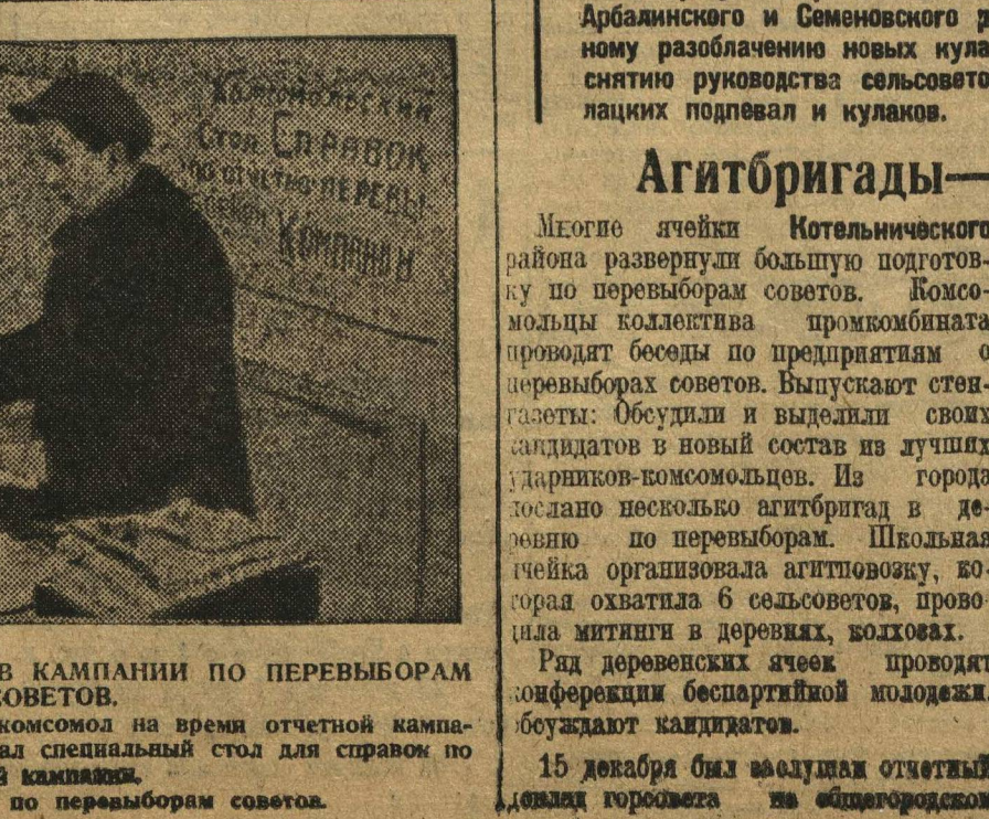
КОМСОМОЛ АКТИВНО УЧАСТВУЕТ В КАМПАНИИ ПО ПЕРЕВЫБОРАМ СОВЕТОВ.

Стокгольм, 22. В Лулеа (Швеция) вчера происходила конференция по вопросу о безработице. Делегаты представляли 12000 рабочих района. Конференция в вопросе о безработице единогласно присоединилась к тактике шведской компартии. Конференция приняла вынесенную коммунистами резолюцию, в которой безработные выражают свою солидарность с Советским Союзом.