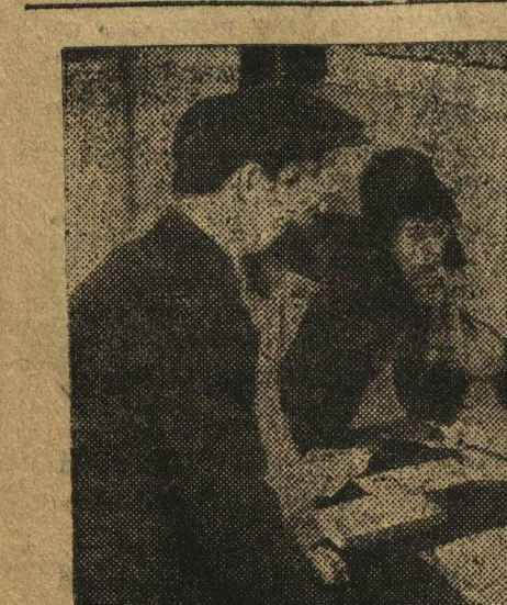
КОМСОМОЛ АКТИВНО УЧАСТВУЕТ В КАМПАНИИ ПО ПЕРЕВЫБОРАМ СОВЕТОВ. На заводе «Красная Пресня» (Москва) комсомол во время отчетной кампании по перевыборам советов организовал специальный стол для справок по перевыборной кампании.

БЕРЛИН, 23. В Вандеге, на Яве закончился процесс 4 вождей национальной партии Индонезия, обвиняемых в подстрекательстве к восстанию против голландского правительства. Суд приговорил инженера Скарне к трем годам тюремного заключения, а остальных трех подсудимых к заключению на срок от 16 месяцев до 2 лет.