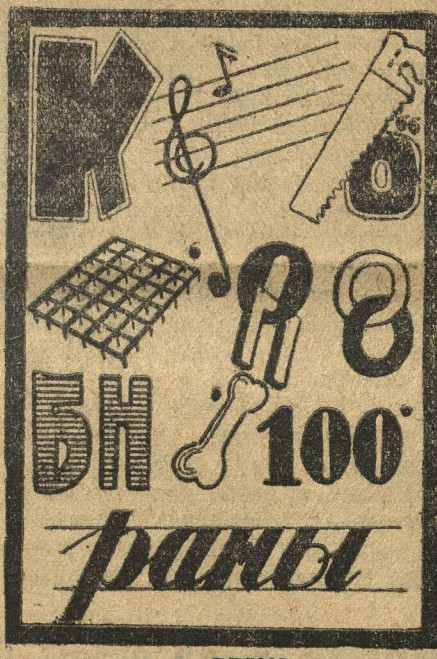
№ 7. РЕБУС.