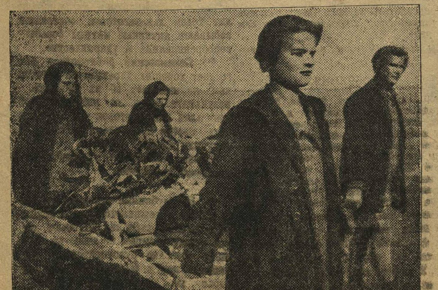
НЕ ОСЛАБЛЯТЬ СБОРА УТИЛЬСЫРЬЯ. На снимке: учащаяся Талженской (ГССР) школы-семидесятки за сбором утильсырья.

Открытие конференции состоится 28 декабря в 6 ч. вечера в Большом зале Кагановского Дворца Культуры. Присаживающиеся делегаты регистрируются в здании Крайкома ВЛКСМ (комната № 20, Кремль, Дворец Свободы, 3 этаж), где получают талоны в общежитие и на питание. Регистрация делегатов производится с 26 декабря в 6 утра до 7 ч. вечера в Кагановском Дворце Культуры. 27 декабря с 7 вечера на случай опоздания поездов, в Крайком (комната № 20) устанавливается дежурство членов оргкомитета до 1 час. ночи. За всякими справками высылать членов оргкомитета по тел. № 10-49.