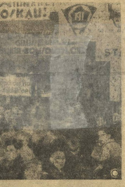
В ряде промышленных районов Германии проходит конференция революционной рабочей молодежи под лозунгами организации защиты СССР.