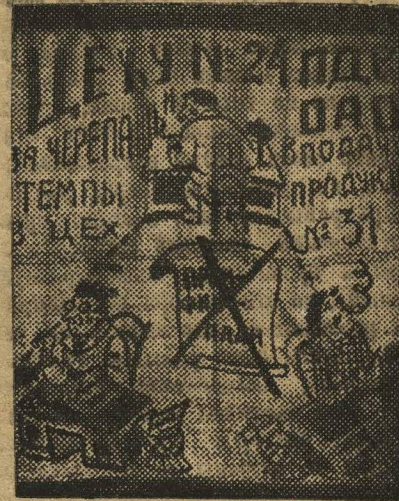
НА СНИМКЕ: рождественские поздравления ижевскими комсомольцами цеху № 24 за черными темами в выходные промфинплана.

шие дни создаются специальные курсы комсомольских работников планирования на 50 человек. Уходящая техника и пионеры проводят сбор рабочих предложений в цехах и по квартирам рабочих. Городские и заводские ячейки в выходные дни работают на субботниках по снабжению завода дровами, бригады ЦРК работают по организации новых распределителей для лучших ударников декабрьского штурма. Комсомольской организацией создана агитгруппа, которая работает по освещению хода штурма, по ее инициативе создана художественная галерея штурма, отображающая лучших ударников, героев штурма и прогульщиков и лодырей, портреты, которых представлены на суд рабочей общественности. В районе, комитетах и ячейках круглые сутки установлено дежурство членов бюро. Ижевская заводская организация заверяет краевой комитет, что при дружном натиске рабочих всего завода, мы сумеем выйти победителями из боя, на краевую конференцию придем с выношенной программой особого квартала.