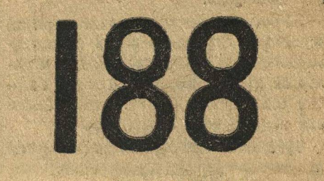
№ 9. ЧИСЛО-ЗАГАДКА.

На столе, в беспорядке дожила монет. Требуется разложить их в четыре ряда так, чтобы в каждом из них было по пять монет.