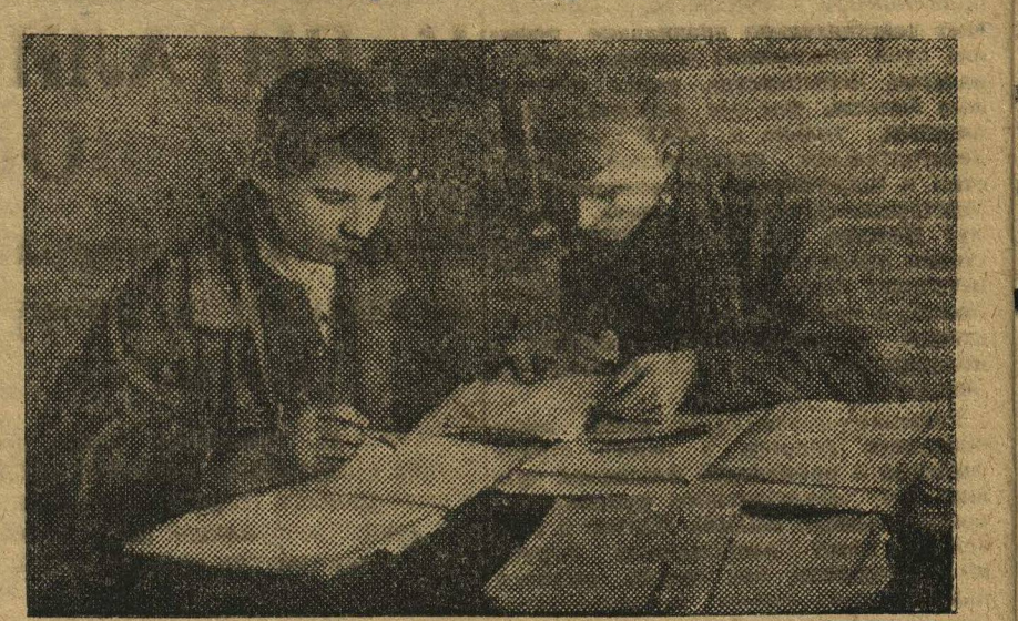
Ряды ленинского комсомола растут. По заводу «Кр. Сормово» за последние время подано около 300 заявлений о вступлении в комсомол. На снимке: секретарь 27-й ячейки в заводском комитете ВЛКСМ сдает заявления вступающих в комсомол к IX съезду и райконференции ВЛКСМ.

Особое внимание необходимо обратить на безусловное выполнение обязательств, взятых организациями ВЛКСМ по шефству над животноводством.