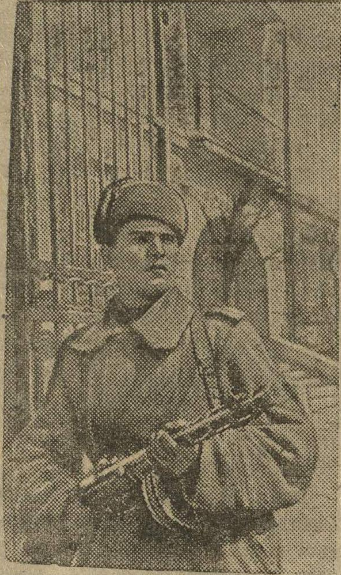
В освобожденном Тарнополе. На снимке: часовой на охране промышленного предприятия.

На пленум приглашаются члены пленума, ревкомиссии, секретари парторганизаций, руководители предприятий и учреждений — коммунисты.