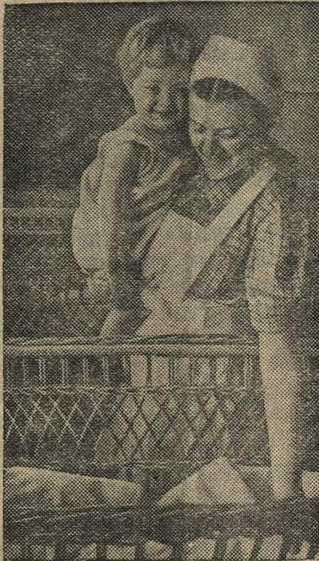
С установлением советской власти в Литве введено социальное страхование, бесплатная медицинская помощь. Открываются десятки новых детских яслей, детских садов, поликлиник, амбулаторий, родильных домов и т. д. На снимке: новые детские ясли № 1 в г. Каунасе.

Советы депутатов трудящихся, руководители местной промышленности и промкооперации нашего района должны проявить большевикскую настойчивость и упорство, чтобы быстрее претворить в жизнь постановление Совнаркома СССР и Центрального Комитета ВКП(б) от 9 января 1941 года—создать обилие предметов широкого потребления и продовольствия для максимального удовлетворения растущих запросов трудящихся нашего района.