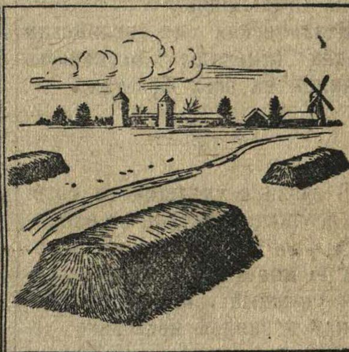
Как правильно складывать навоз