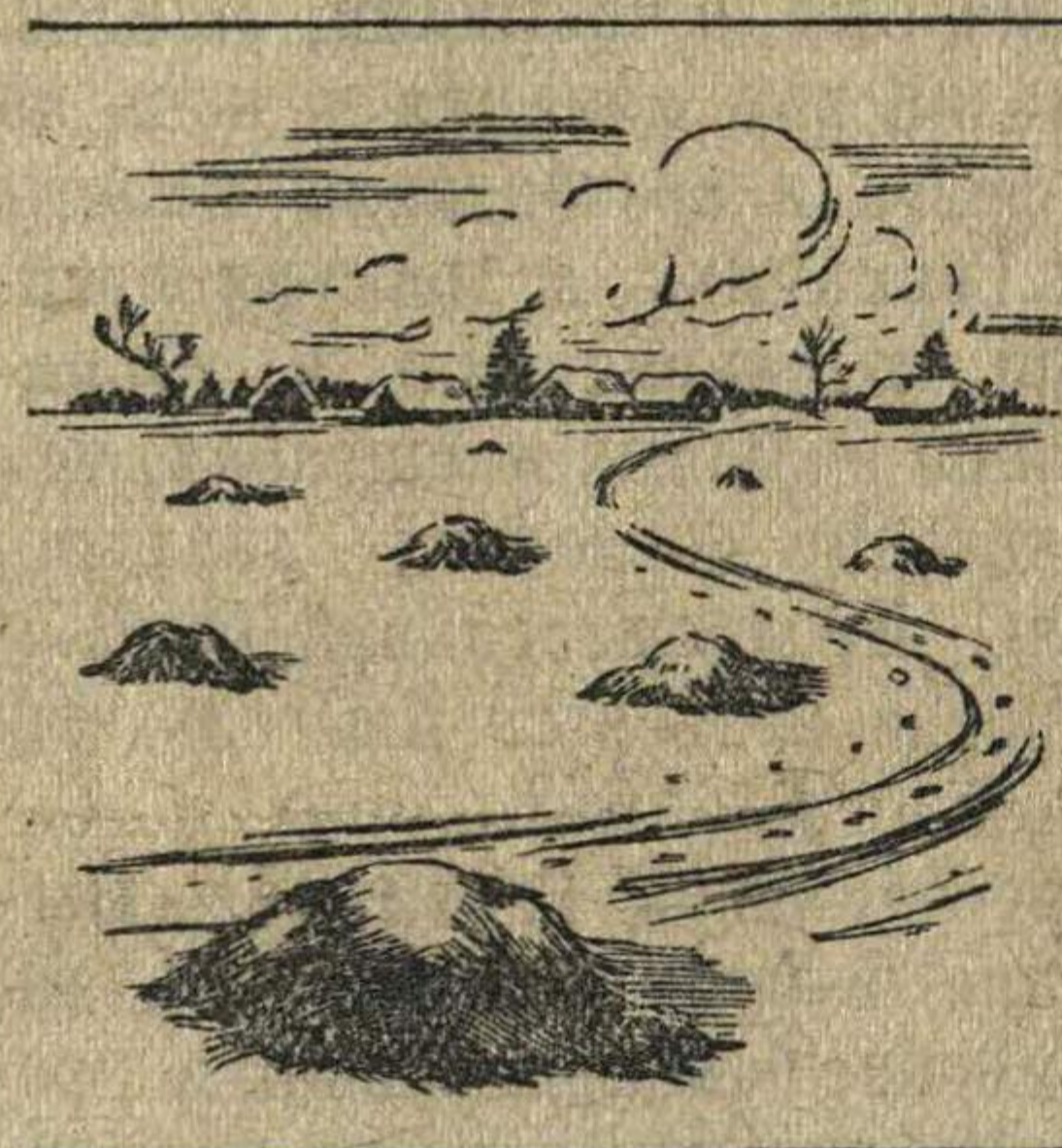
Как не надо складывать навоз в поле.