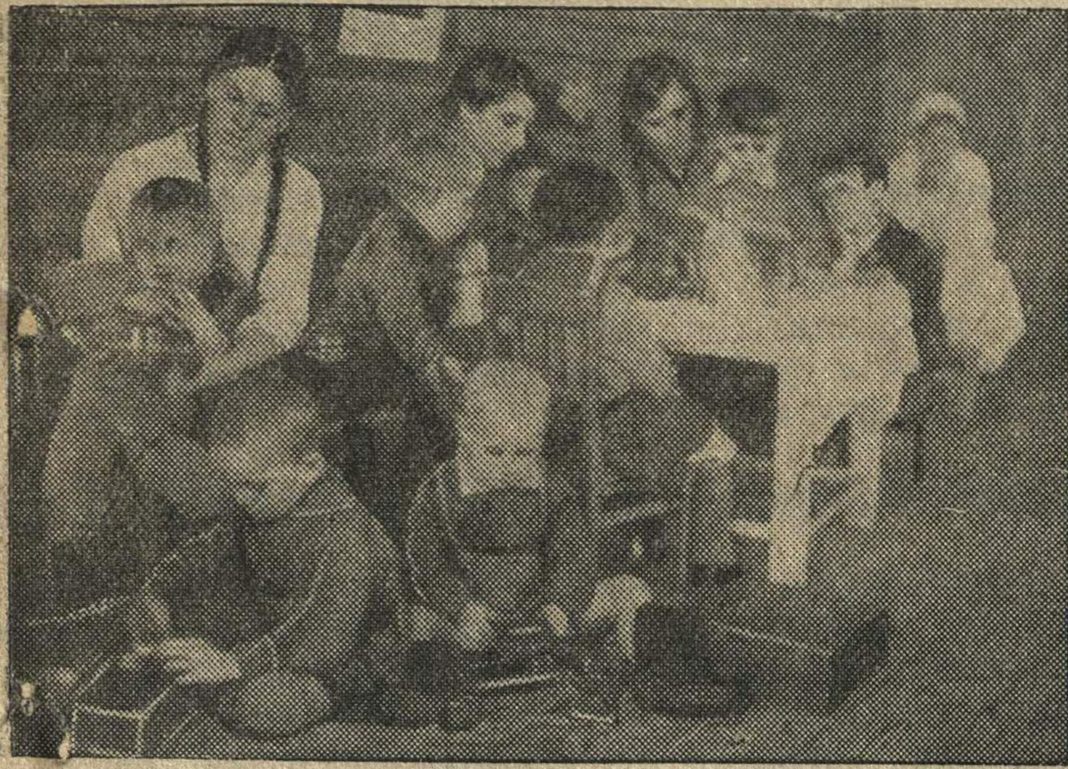
В день выборов депутата в Совет Союза 26 января 1941 года.