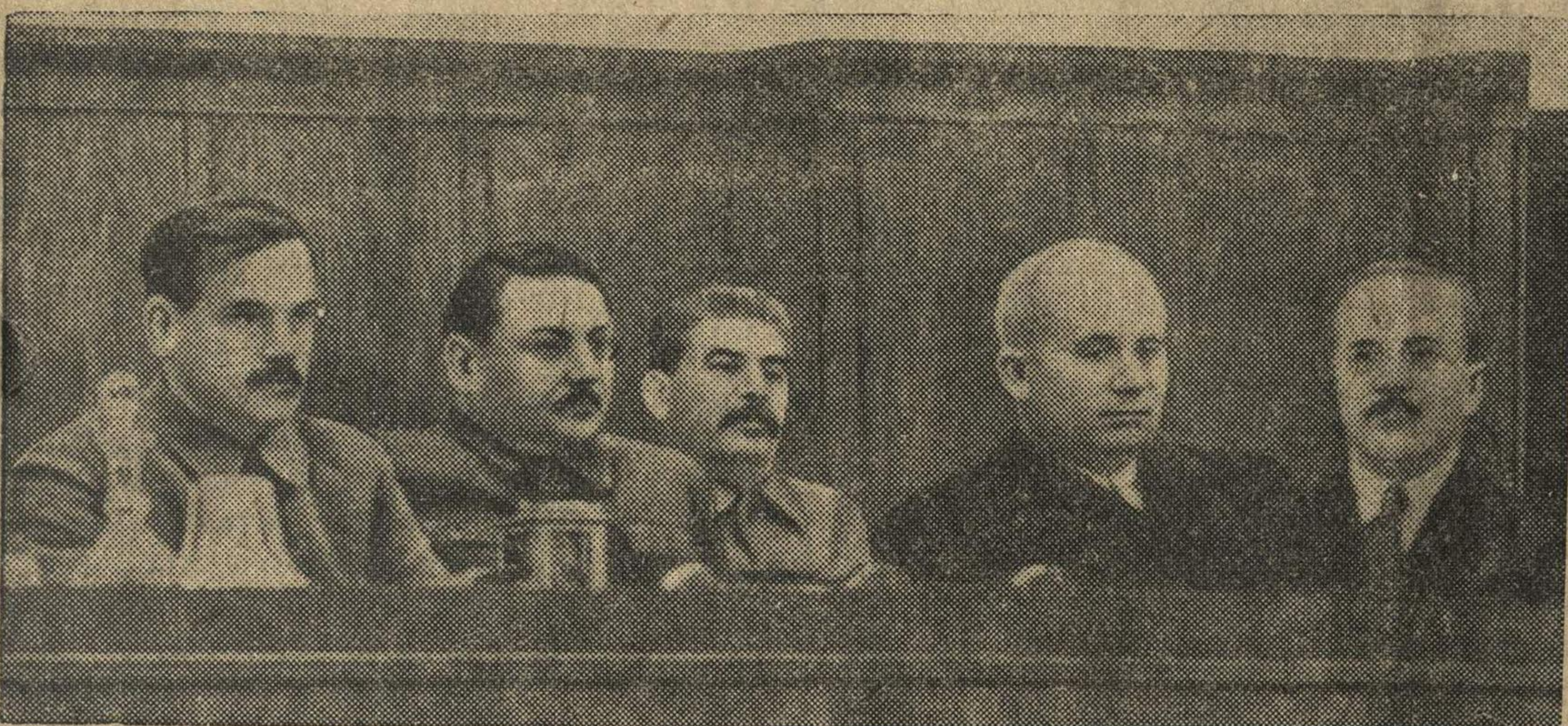
Товарищи А. А. Андреев, А. А. Жданов, И. В. Сталин, Н. С. Хрущев и В. М. Молотов в президиуме конференции.