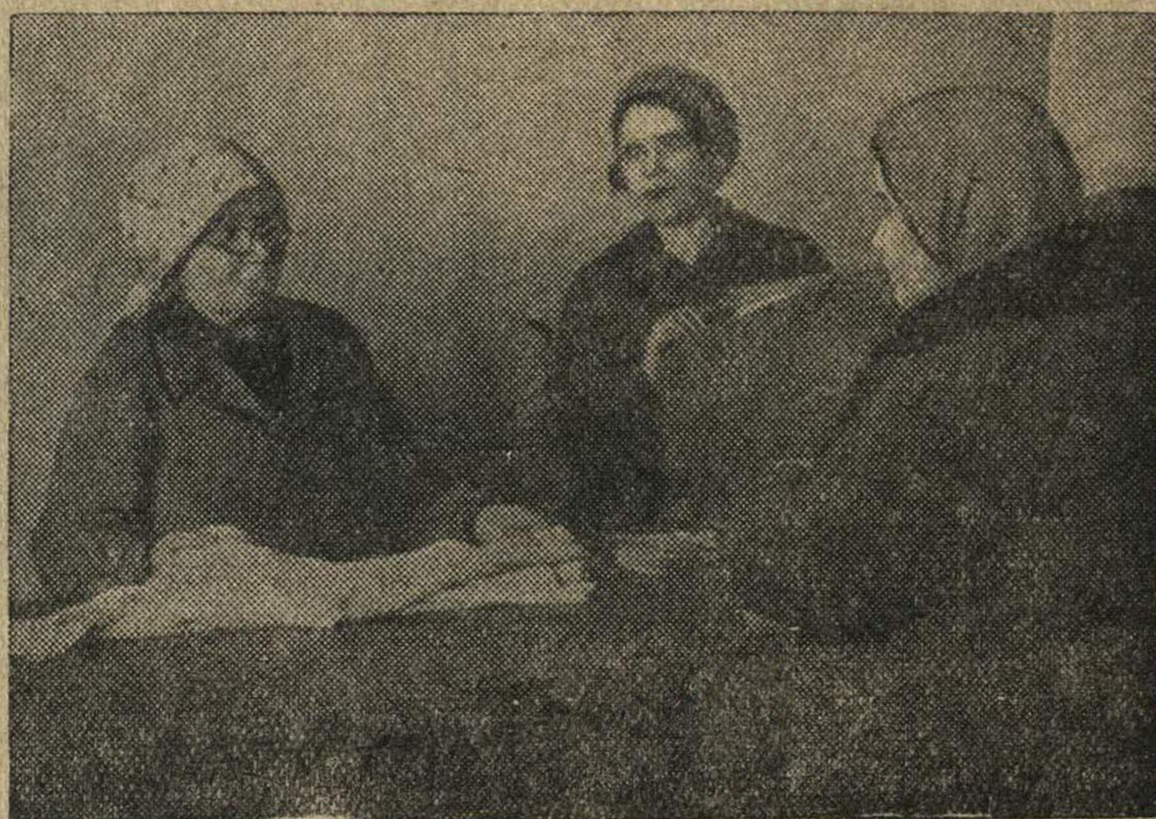
Красильный цех промартели им. М. Горького систематически перевыполняет план.