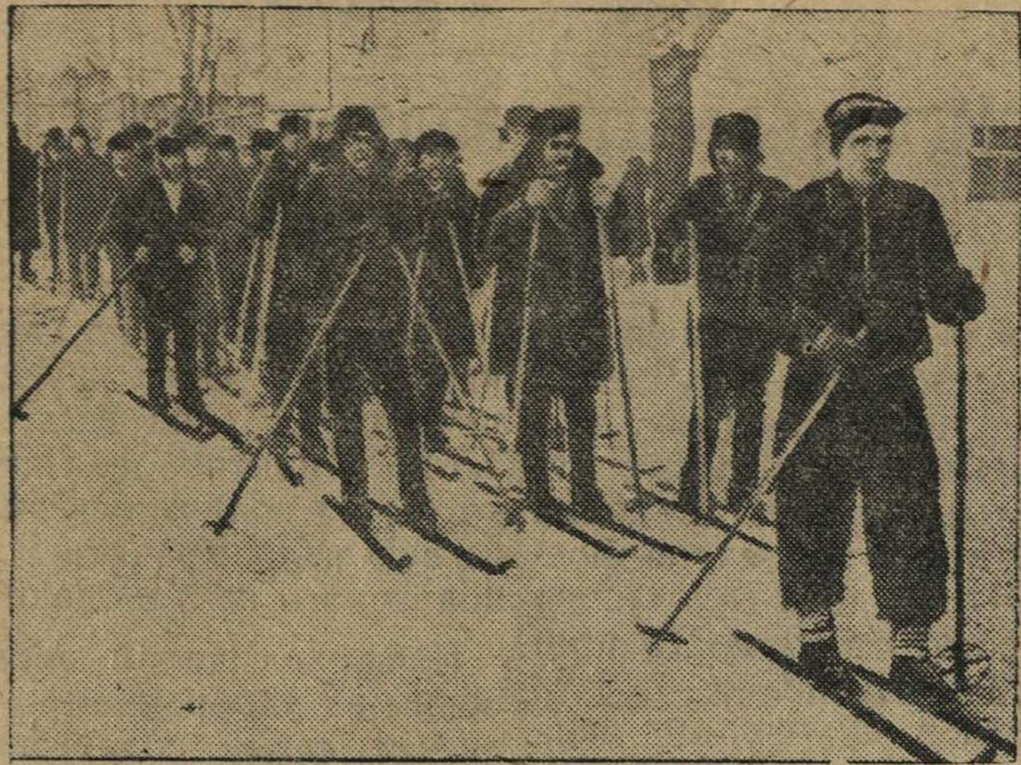
На снимке: призывники готовятся к сдаче норм на значок „Готов к труду и обороне“.