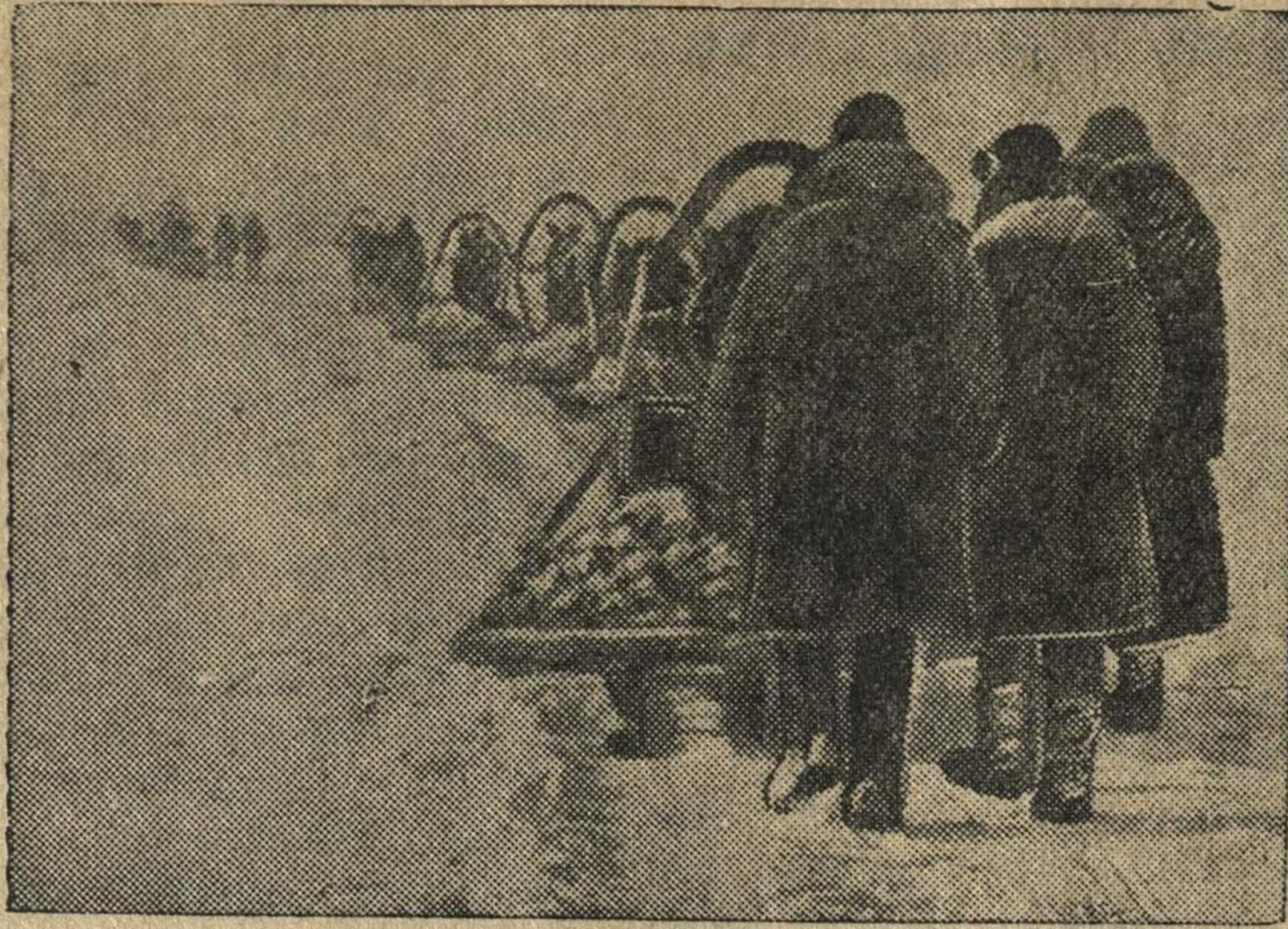
На снимке: колхозники Панфиловского колхоза. Они везут камень с Кирилловского рудника к трассе дороги Горький—Арзамас—Кулебаки.