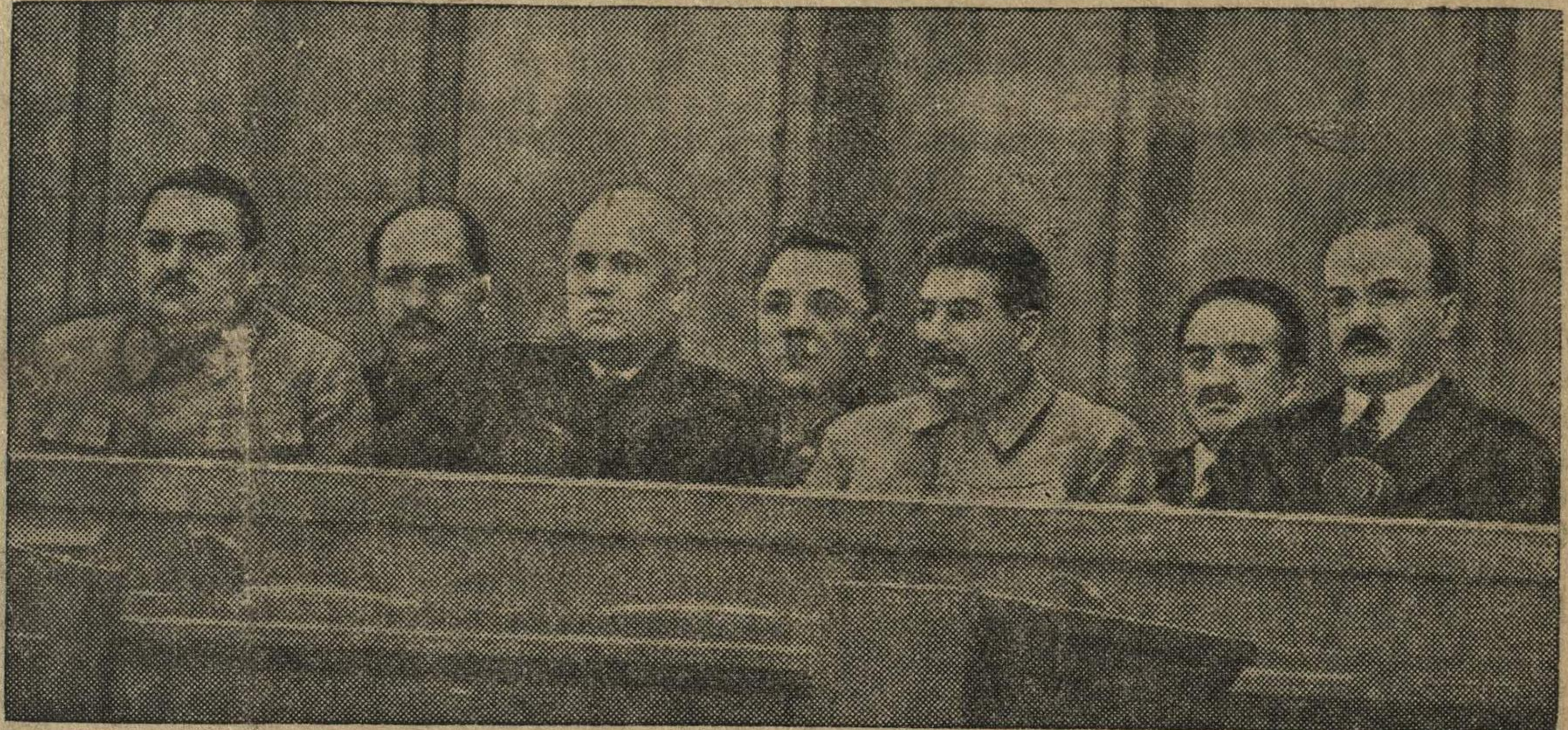
Руководители партии и правительства на совместном заседании Совета Союза и Совета Национальностей. Справа налево: товарищи В. М. Молотов, А. И. Микоян, И. В. Сталин, К. Е. Ворошилов, Н. С. Хрущев, Л. М. Каганович и А. А. Жданов.

25 февраля в Кремле открылась VIII сессия Верховного Совета СССР