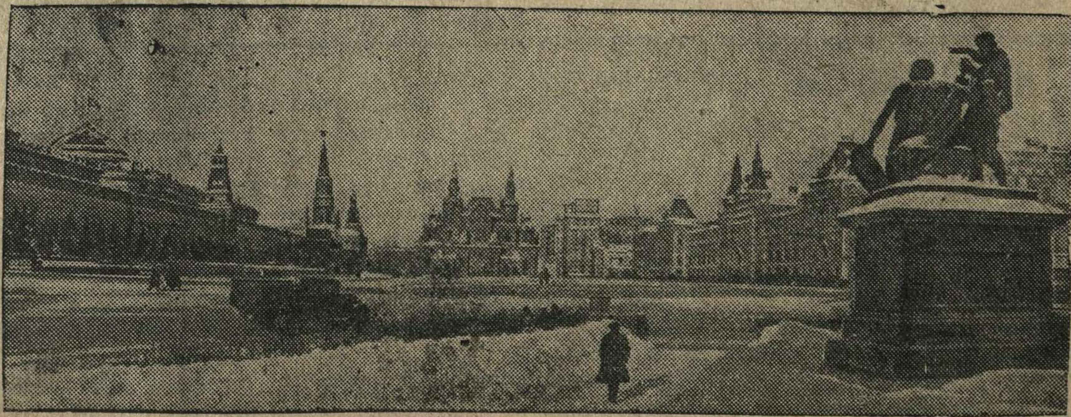
Красная площадь (Москва).