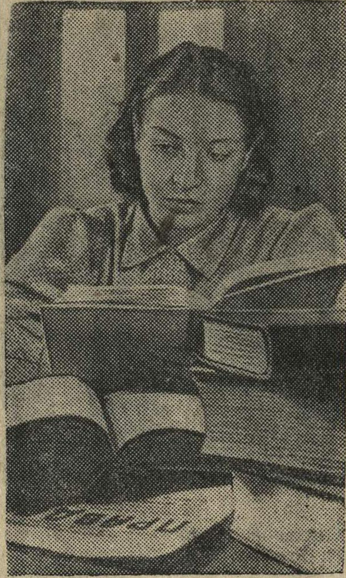
В гор. Каунасе (Литовская ССР) открылся воскресный марксистско-ленинский университет. Здесь занимаются свыше 700 человек.