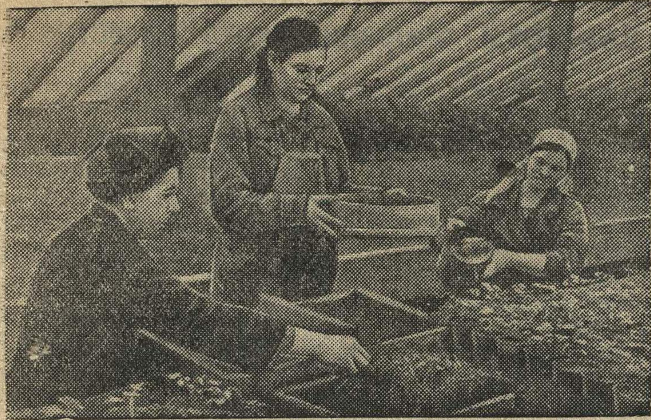
Колхоз „Заветы Ильича“ (Красногорский район, Московская область) за успешную работу в 1940 году получил районное переходящее красное знамя. В 1941 году колхоз построил новую теплицу площадью 250 кв. метров, в которой выращиваются на зелень лук, петрушка и свекла.

На снимке: пикировка томатов для высадки в парники.