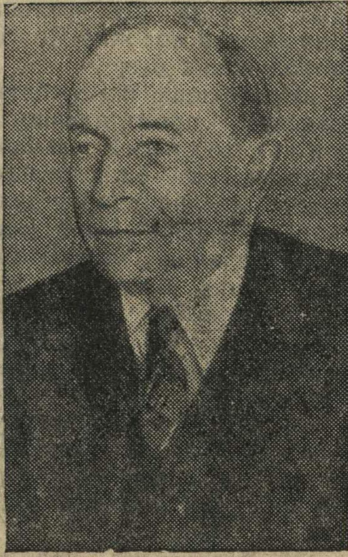
Председатель Президиума Верховного Совета Карело-Финской ССР О. В. Куусинен.