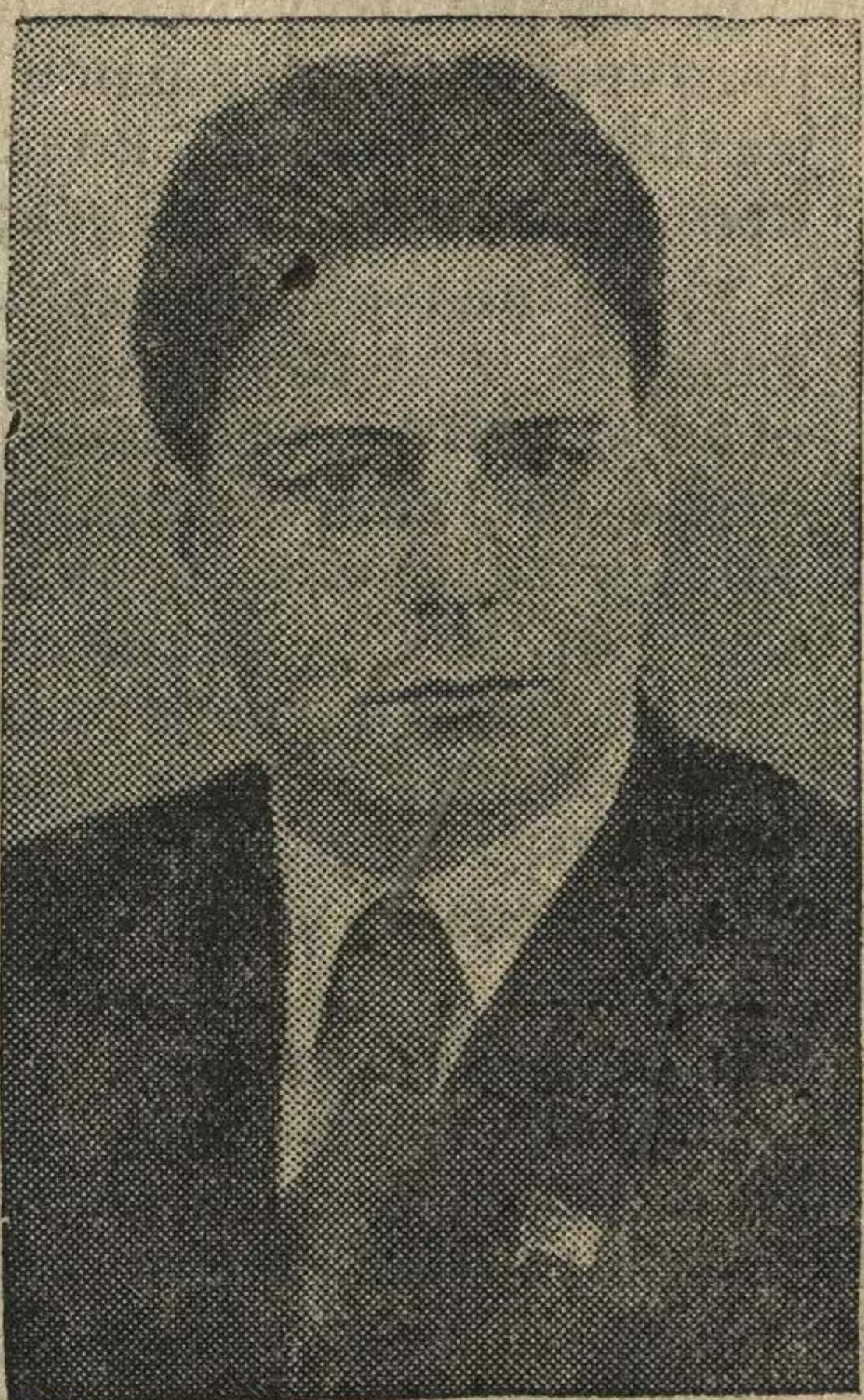
Председатель Совнаркома Карело-Финской ССР П. С. Прокконен.

31 марта страна отметила годовщину образования Карело-Финской ССР (31 марта 1940—31 марта 1941 года).