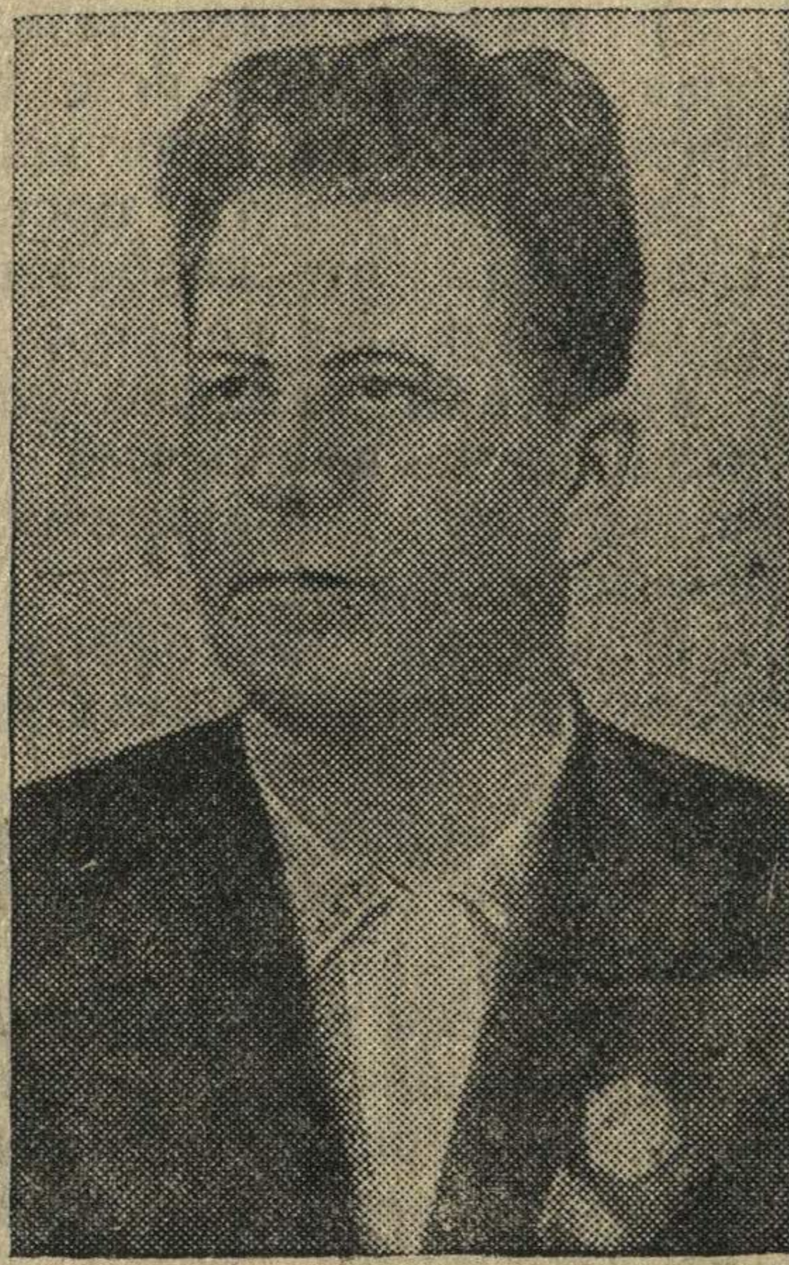
Первый секретарь ЦК КП(б) Карело-Финской ССР Г. Н. Куприянов.