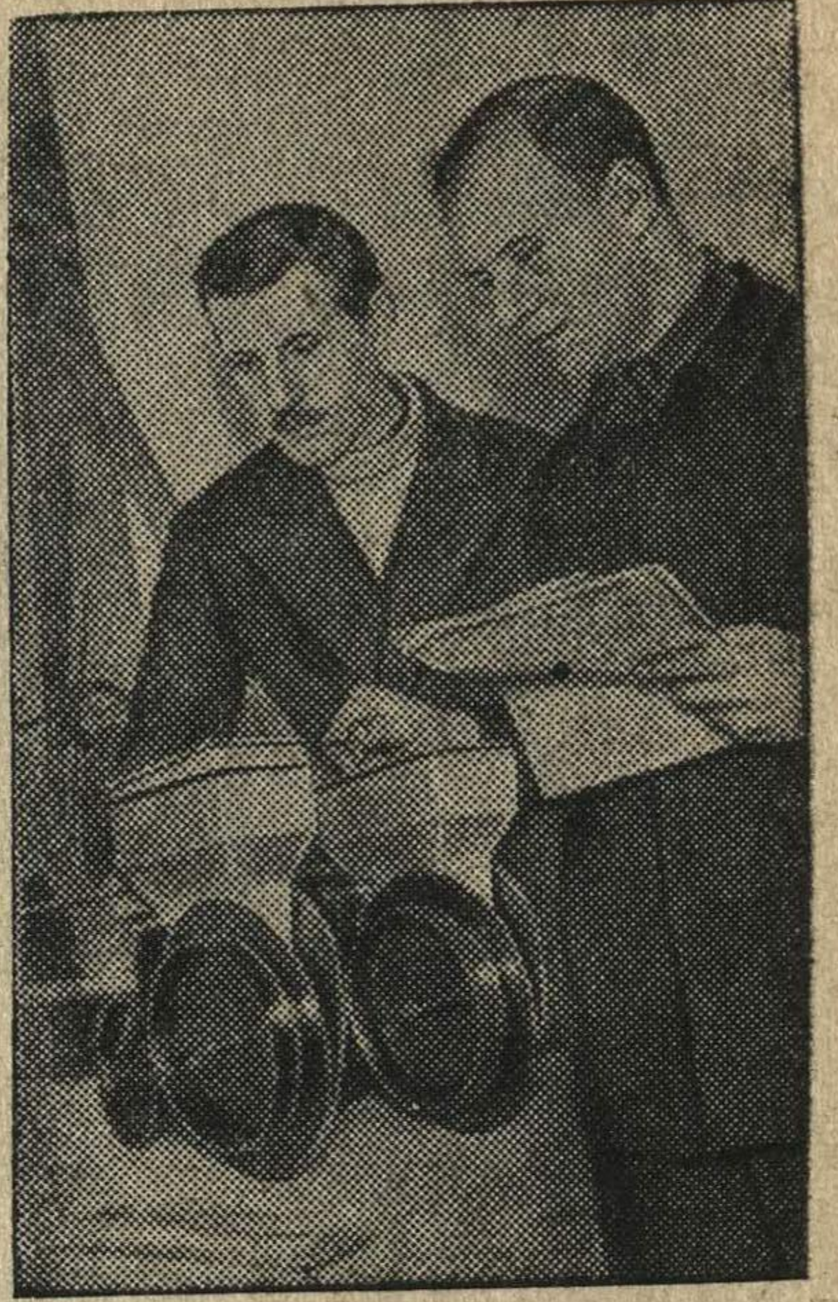
Научно-исследовательским институтом овощного хозяйства (Московская область) сконструирована и изготовлена первая двухрядная ручная овощная сеялка для открытых грунтов.