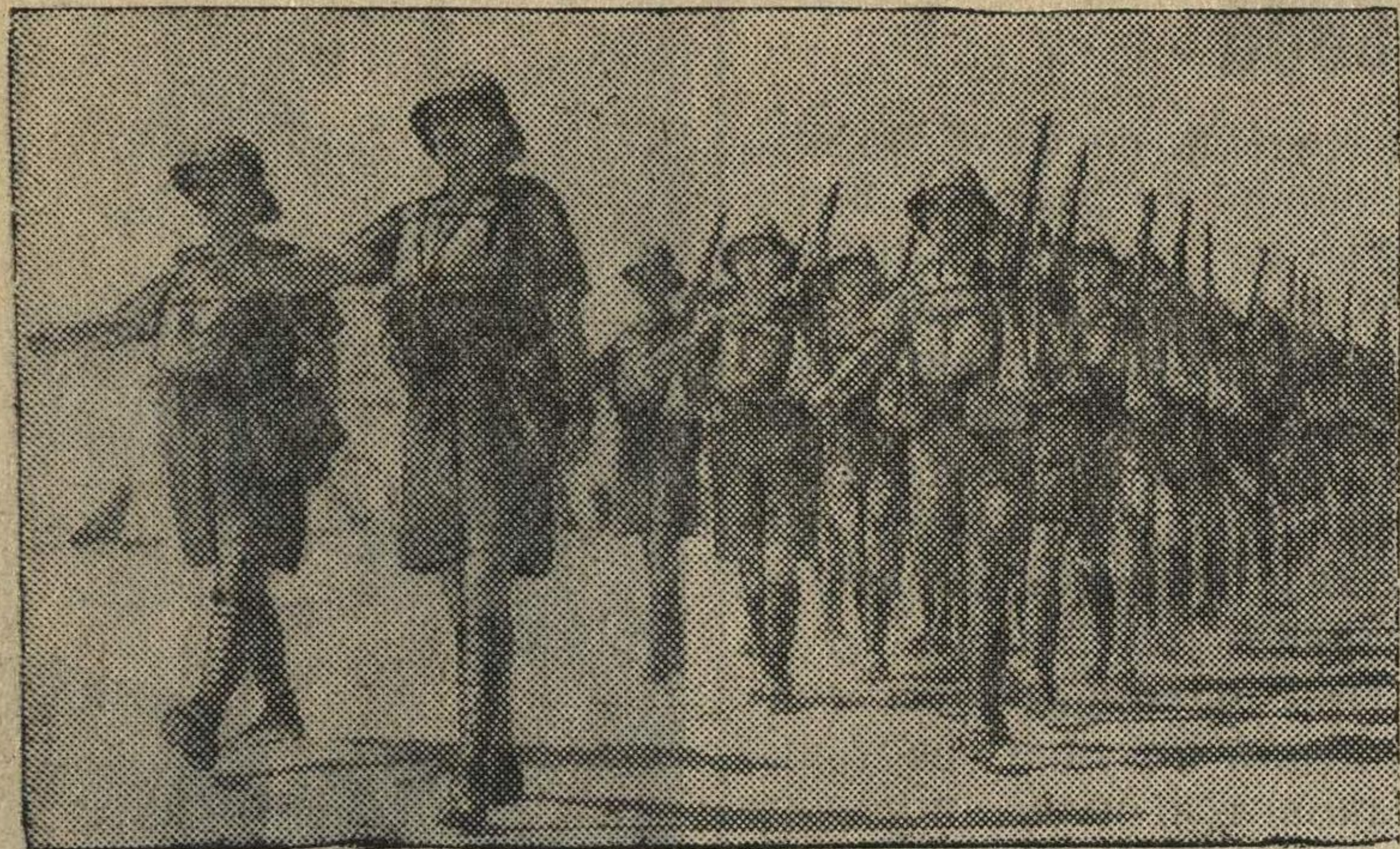
Английские войска на фронте в Западной пустыне (Африка).