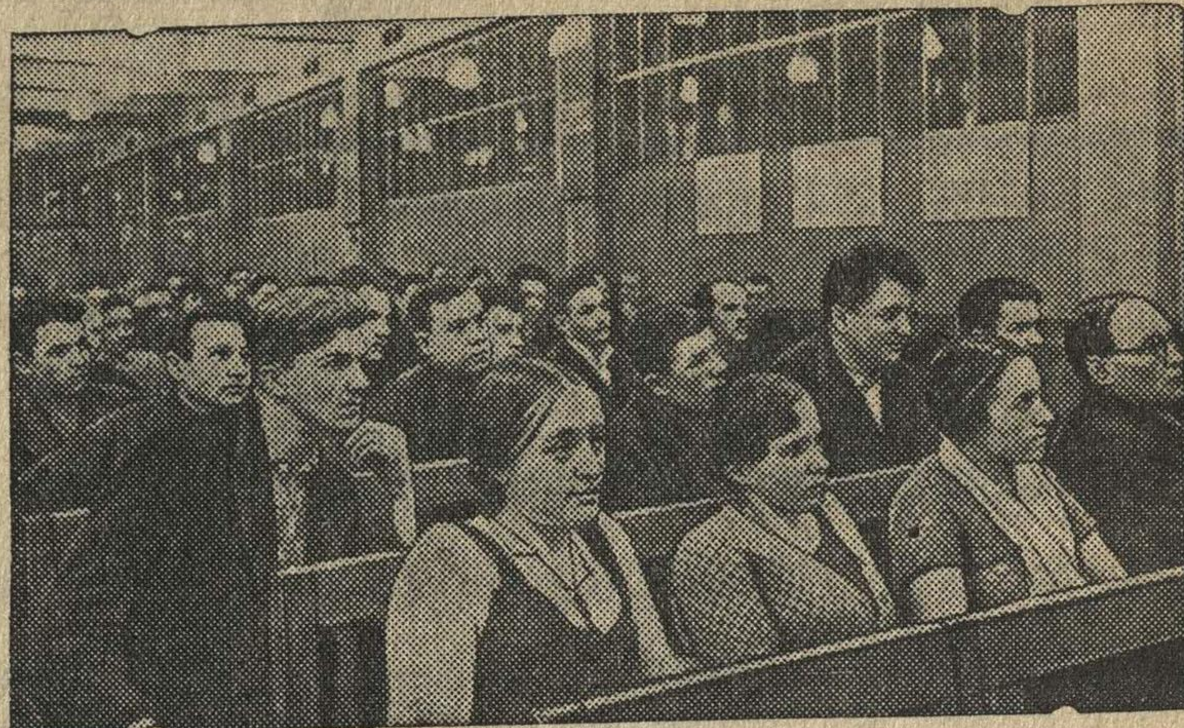
Партсобрание в литейном цехе № 3.