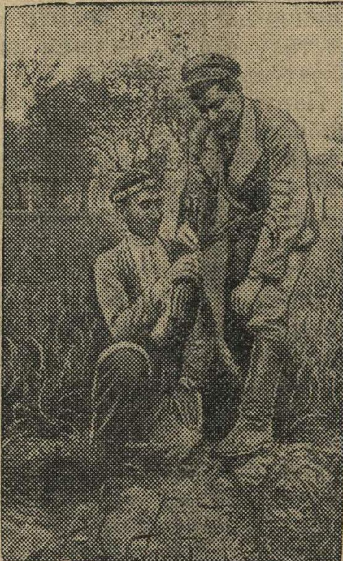
Хороши всходы озимой пшеницы в колхозе имени 3-й пятилетки (Октябрьский аулсовет, Чарджоуская область, Туркменская ССР).

В каждом селе должны быть хорошие, культурные водоемы. Это явится базой для развития новых отраслей хозяйства и одним из важнейших условий устойчивых высоких урожаев.