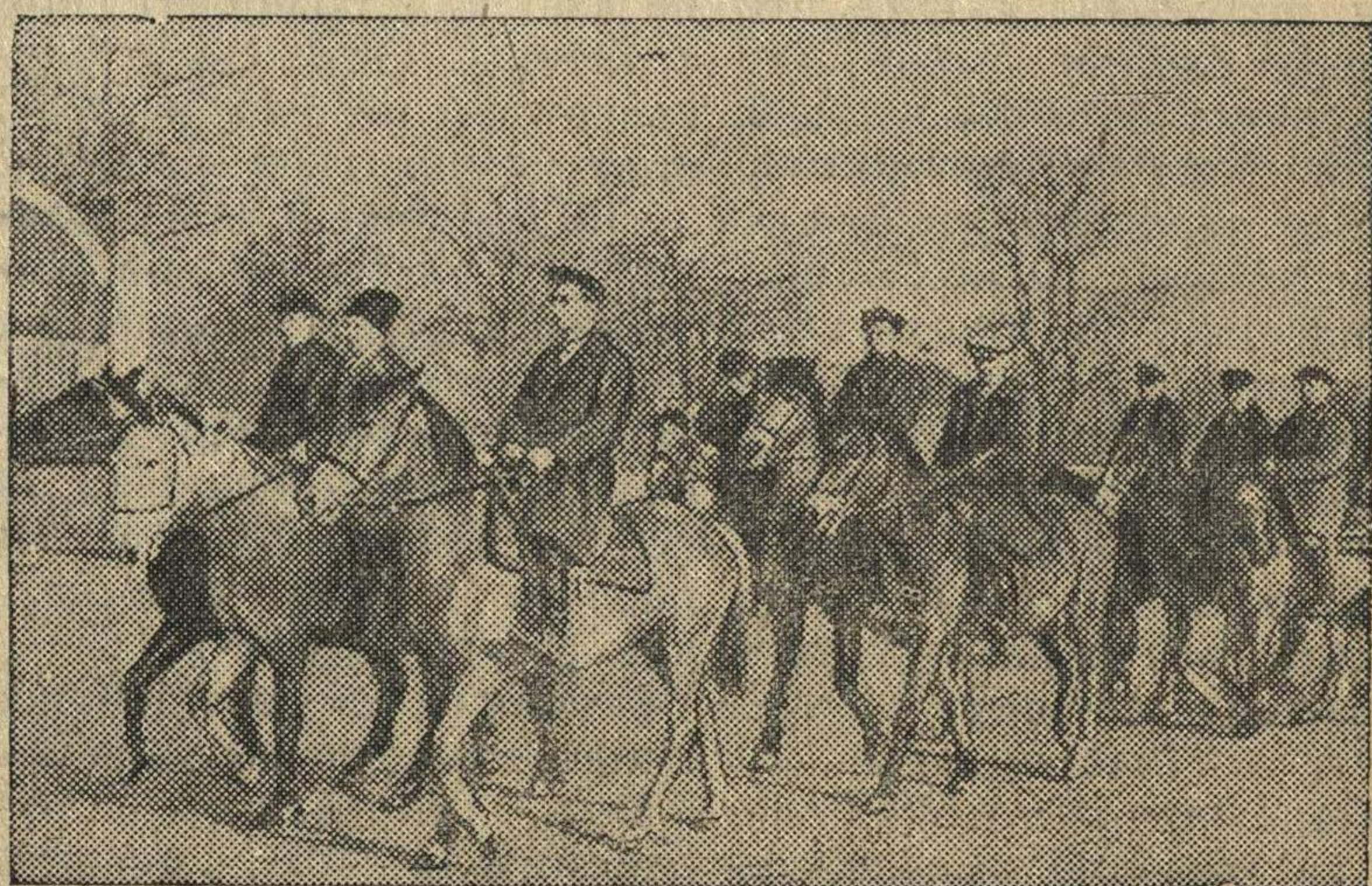
Ворошиловские всадники колхоза им. Чапаева (Золотоношский район, Полтавской области) на тренировке.