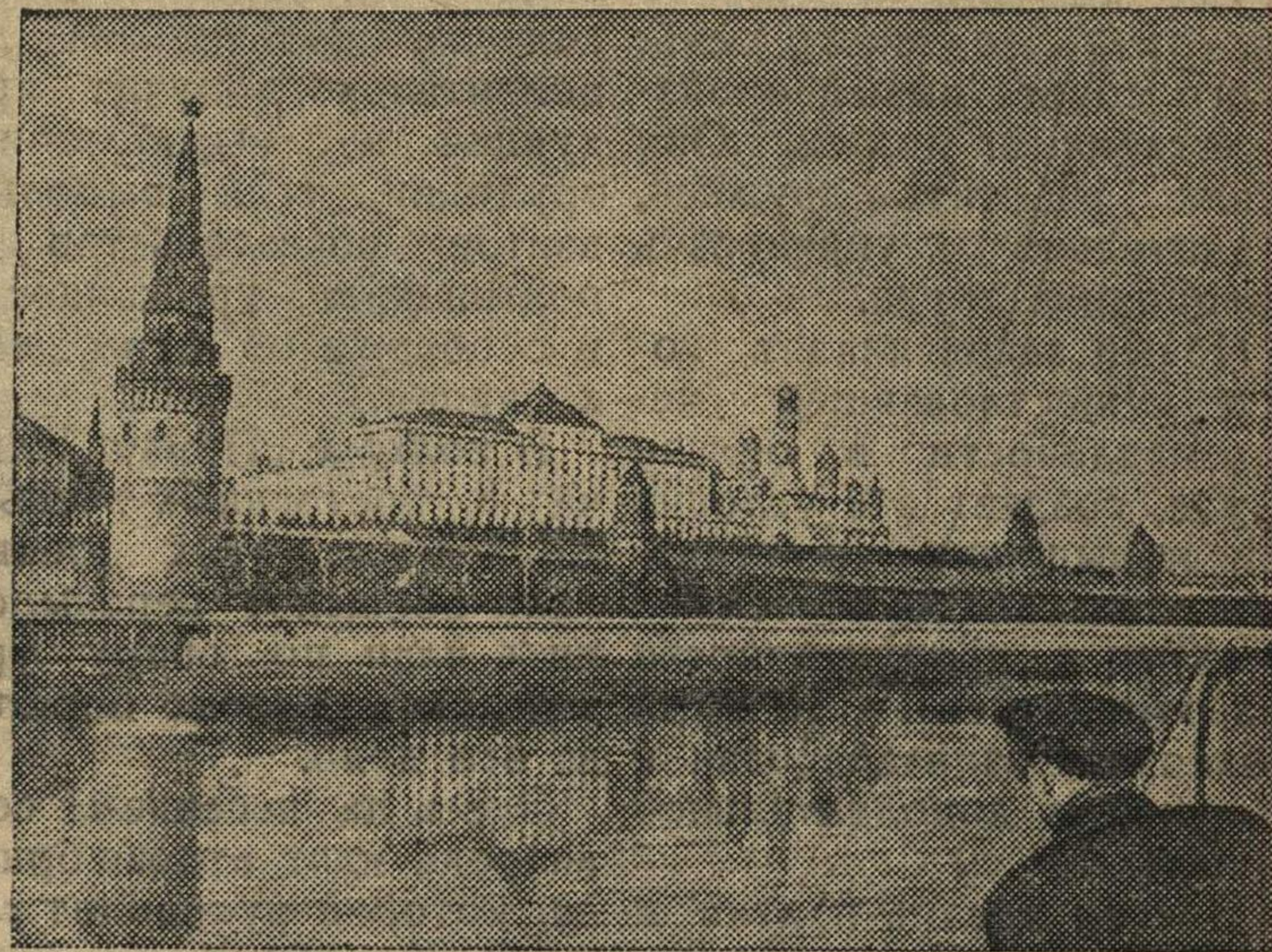
Вид на Кремль с Большого Каменного моста (Москва).

Бюро обкома ВКП(б) обязало райкомы ВКП(б) установить постоянный контроль за проведением в жизнь постановления СНК СССР и ЦК ВКП(б) «О дополнительной оплате труда колхозников за повышение урожайности сельскохозяйственных культур и продуктивности животноводства по Горьковской области» и обеспечить своевременную выдачу авансов колхозникам за перевыполнение заданий в зависимости от выполнения колхозами обязательств перед государством.