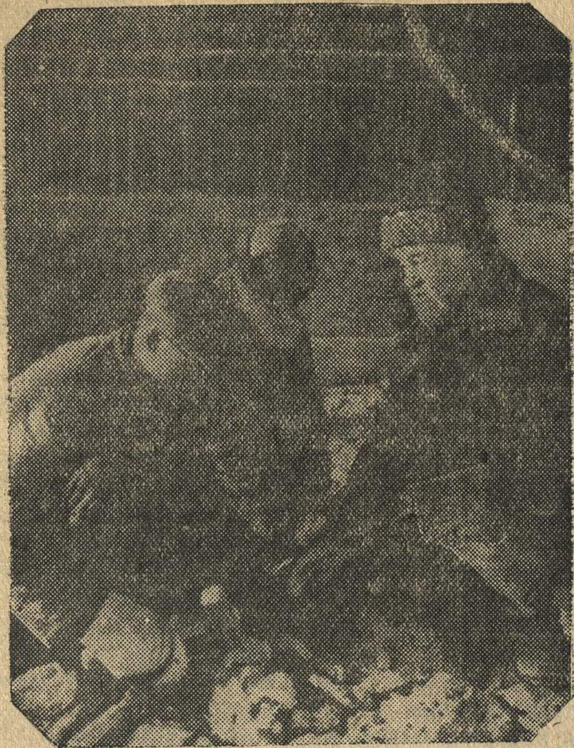
Арзамасский дорожностроительный участок подготовит большую группу мостовщиков для работы на трассе.