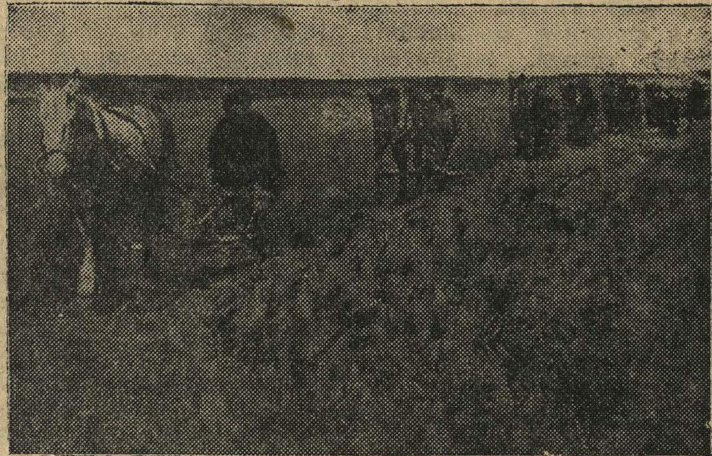
На весеннем севе в Хватовском колхозе имени Куйбышева, Арзамасского района.