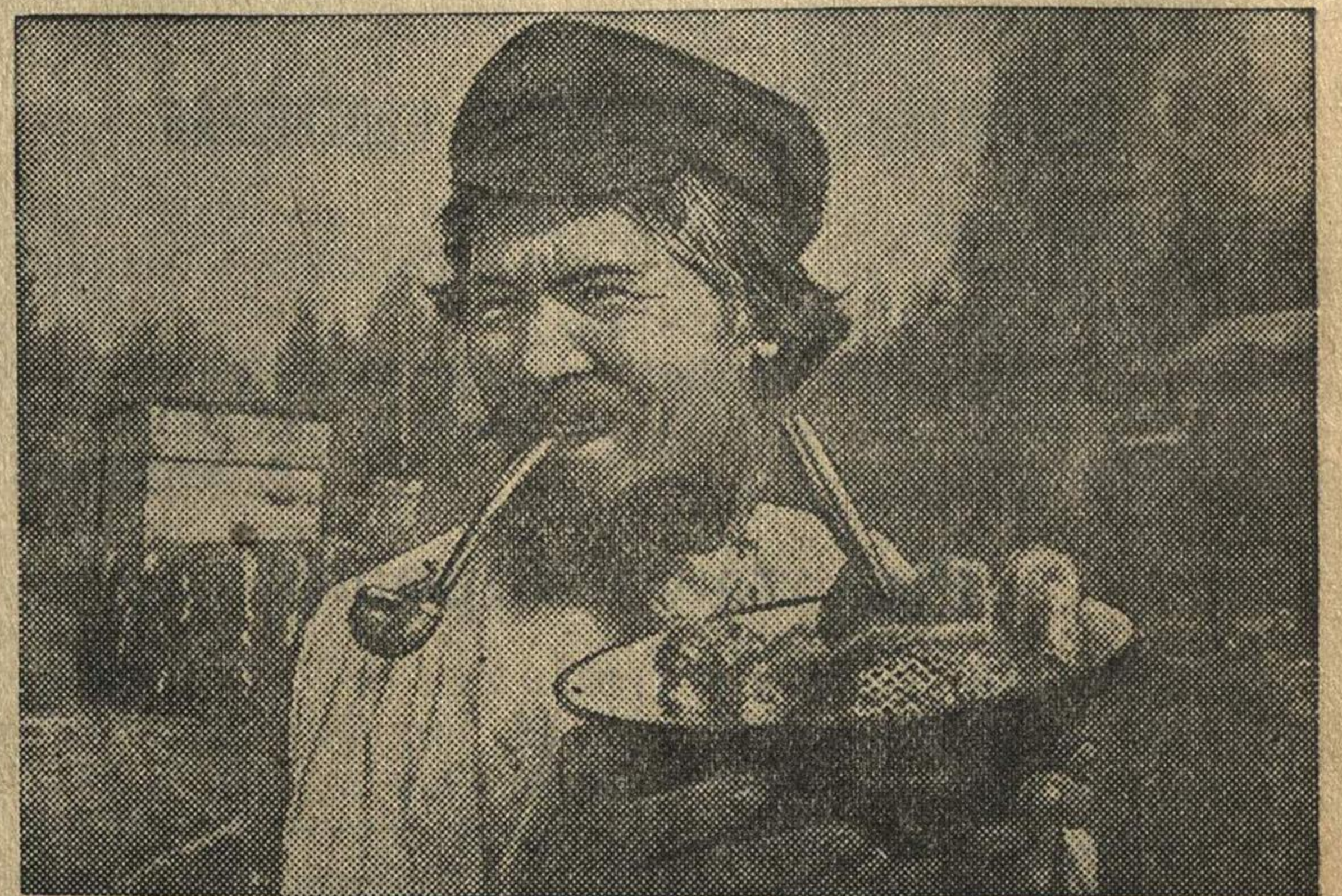
На пасеке колхоза имени Крупской, Ибресинского района, Чувашской АССР.

(Репродукция из альбома „Смотр побед социалистического сельского хозяйства“, выпущенного изд-вом „Сельхозгиз“, фото А. Скурихина). Фотохроника (ТАСС).