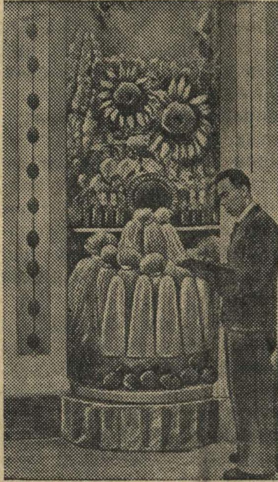
Стэнд технических культур в вводном зале павильона „Сибирь“.

На Всесоюзной сельскохозяйственной выставке.