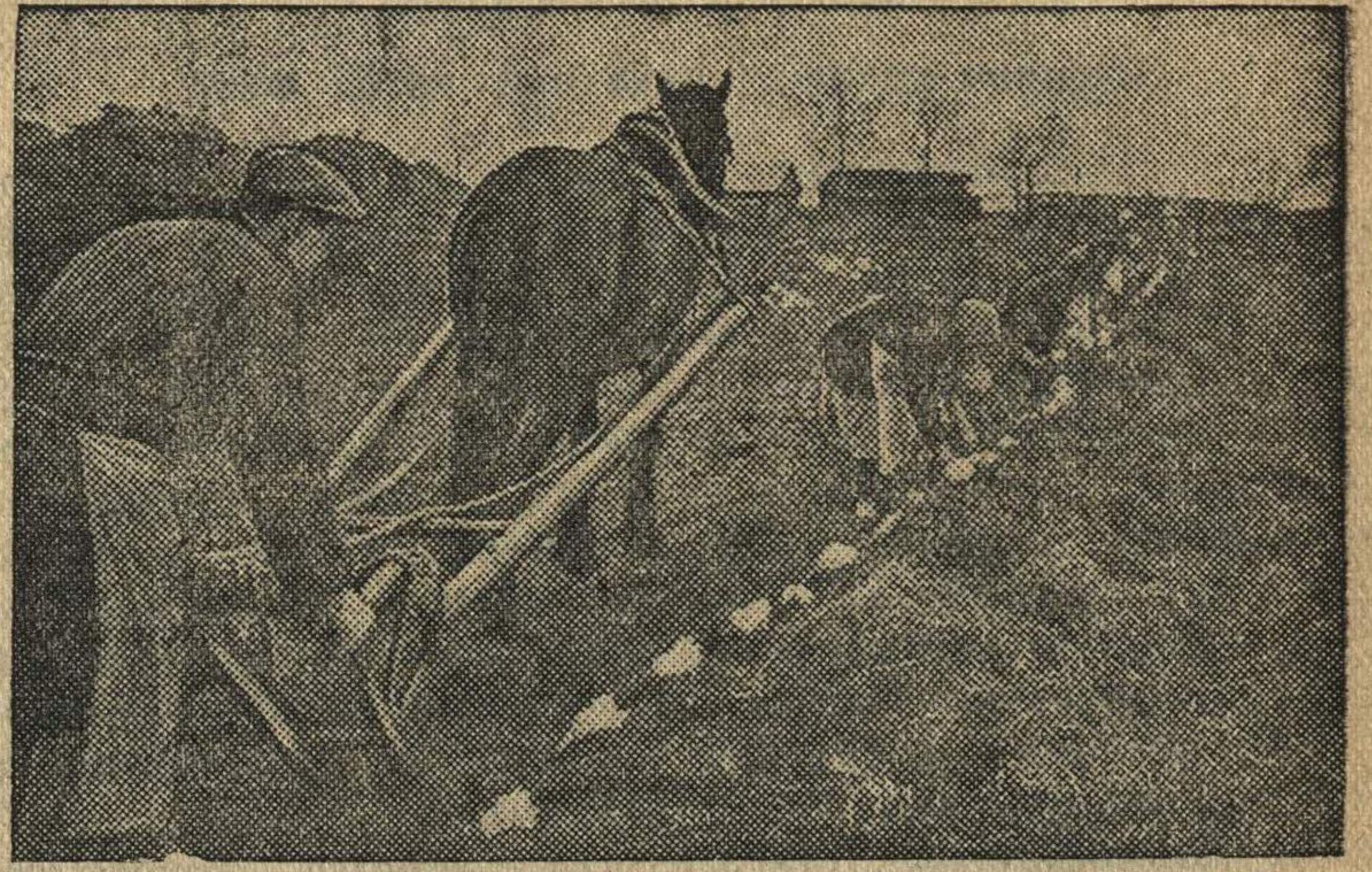
Посадка семенной капусты в колхозе им. Ильича (Кунцевский район, Московской области).