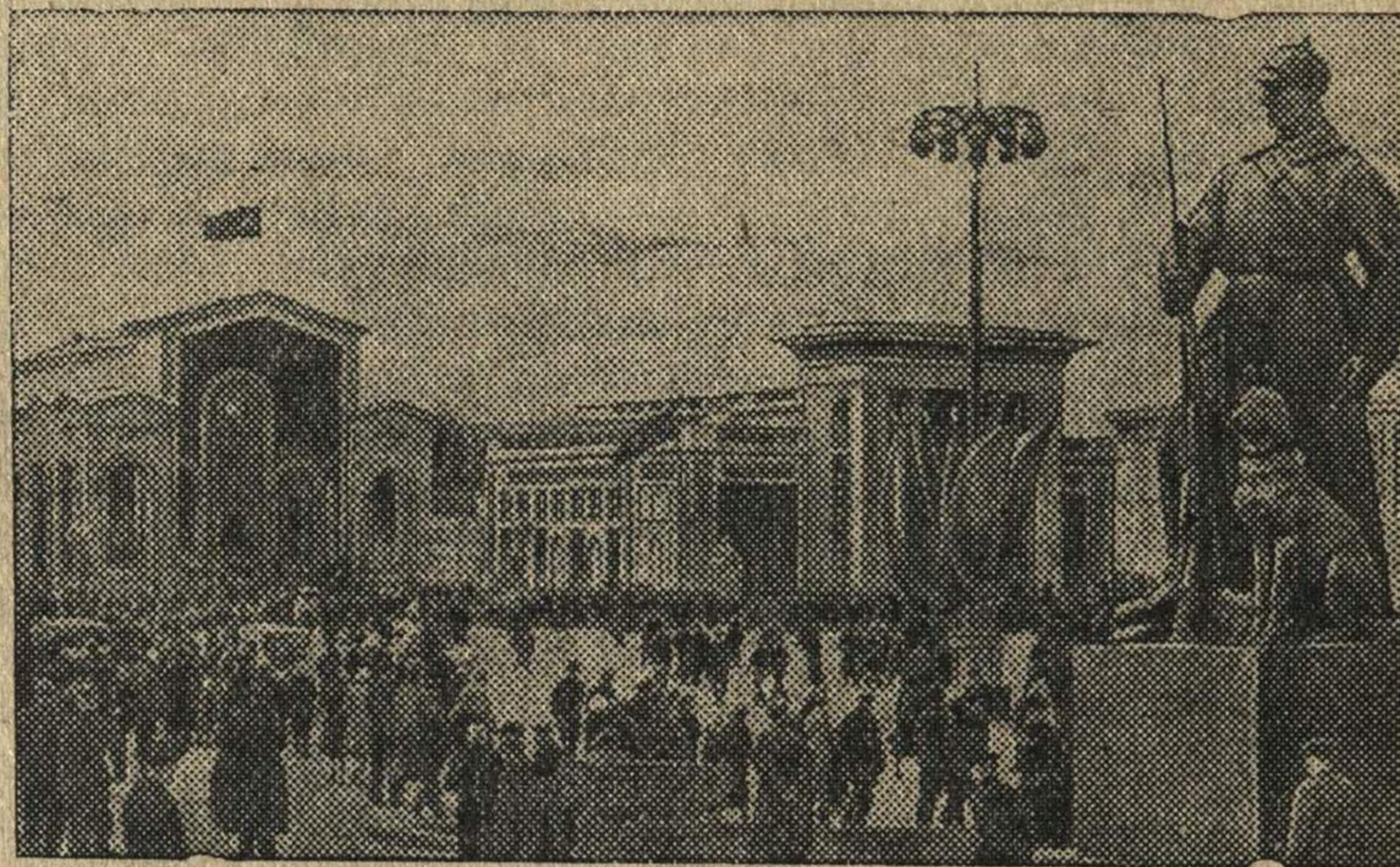
Площадь Колхозов в день открытия выставки.

На Всесоюзной сельскохозяйственной выставке.