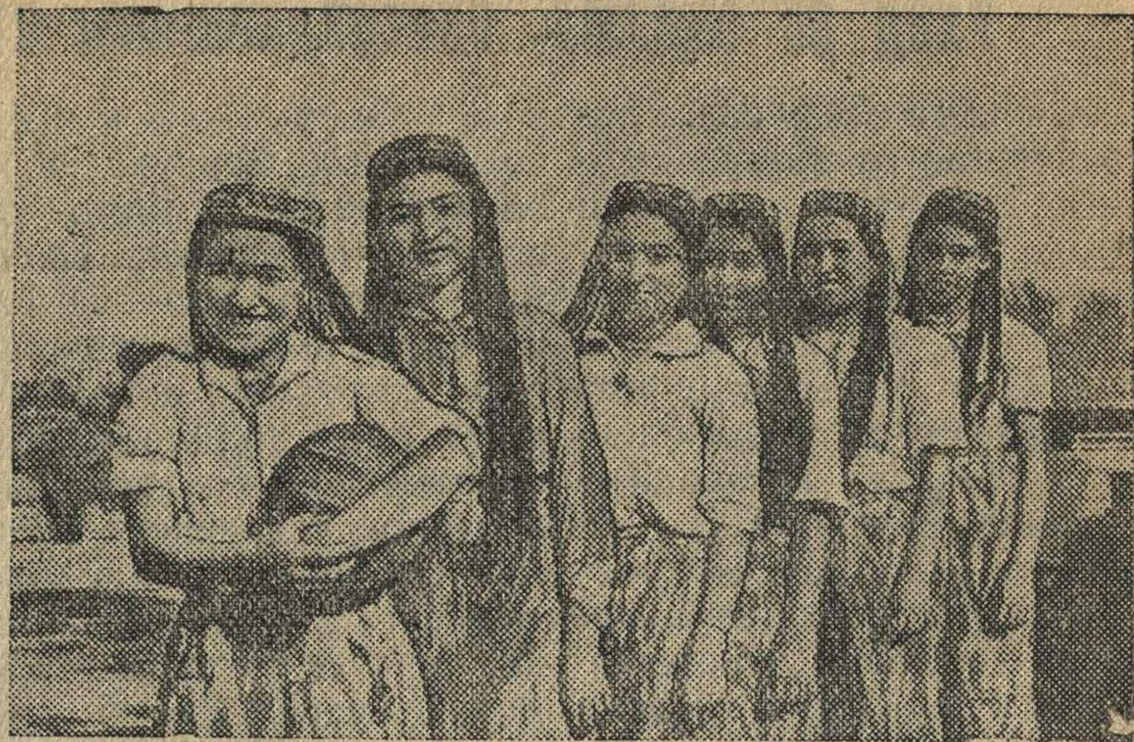
Колхоз имени Буденного, Избаскенского района, Андижанской области, Узбекской ССР — участник Всесоюзной сельскохозяйственной выставки 1941 г. по физкультурной работе.

На снимке: женская волейбольная команда колхоза.