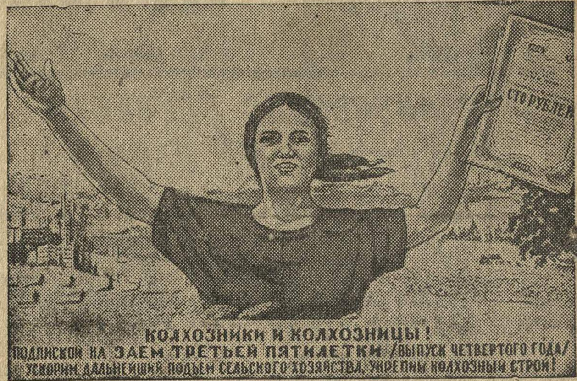
КОЛХОЗНИКИ И КОЛХОЗНИЦЫ! ПОДПИШИСЬ НА ЗАЕМ ТРЕТЬЕЙ ПЯТИЛЕТКИ (ВЫПУСК ЧЕТВЕРТОГО ГОДА) УКРЕПИ ДАЛЬНЕЙШИЙ ПОДЪЕМ СЕЛЬСКОГО ХОЗЯЙСТВА, УКРЕПИ КОЛХОЗНЫЙ СТРОИТЕЛЬСТВО!