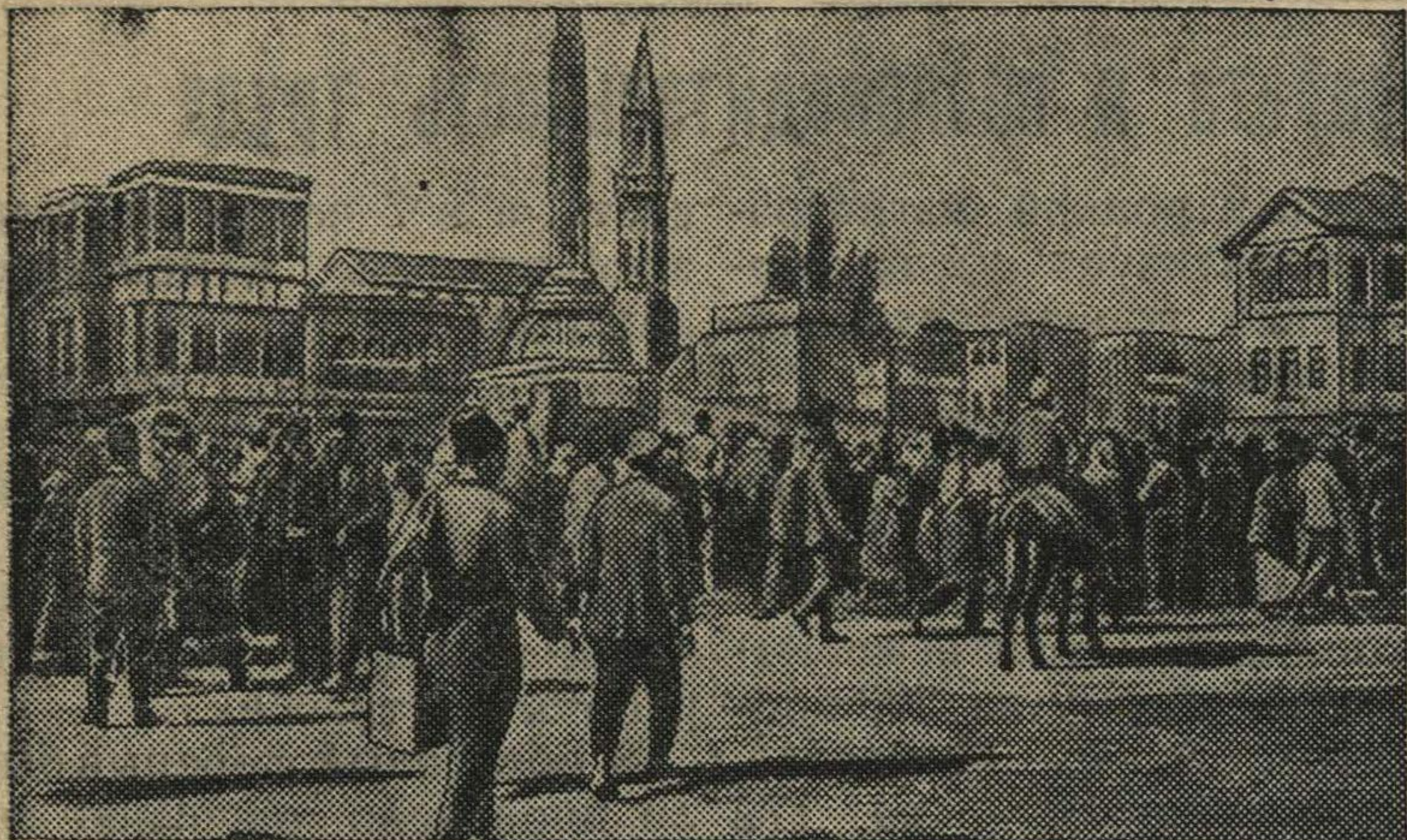
Площадь в Дамаске (столица Сирии).