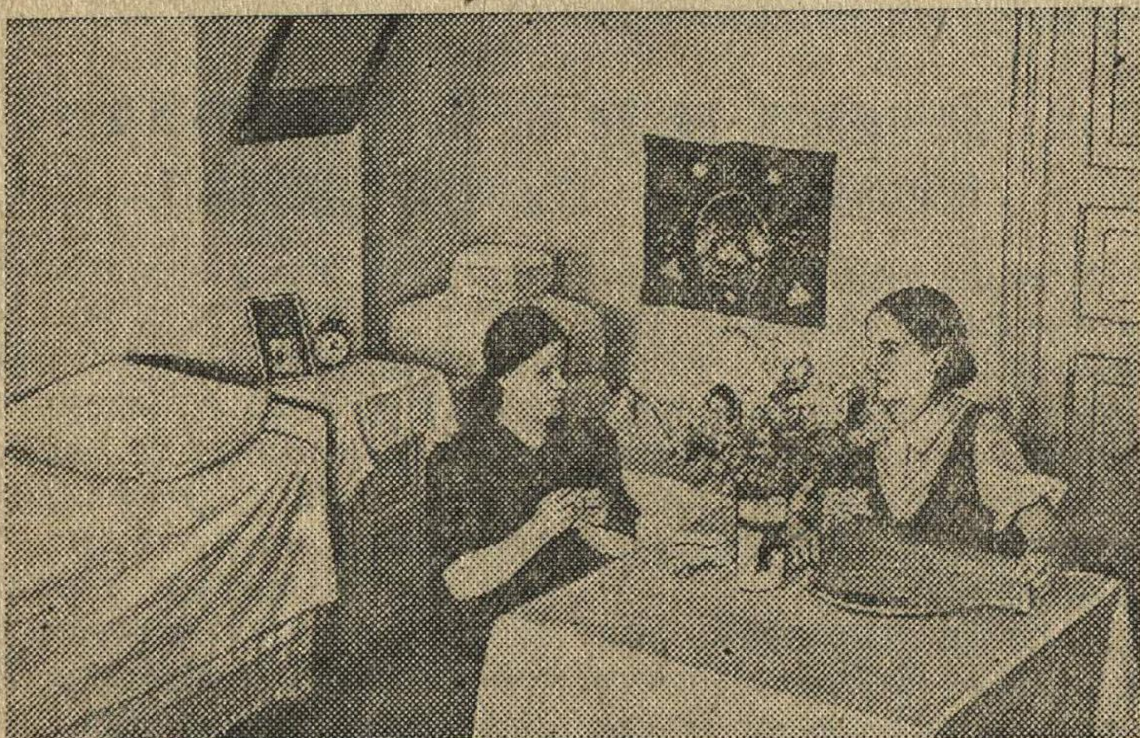
На средства из директорского фонда для рабочих Загорской трикотажной фабрики № 8 (Московская область) в конце 1940 г. выстроен 5-этажный жилой дом.