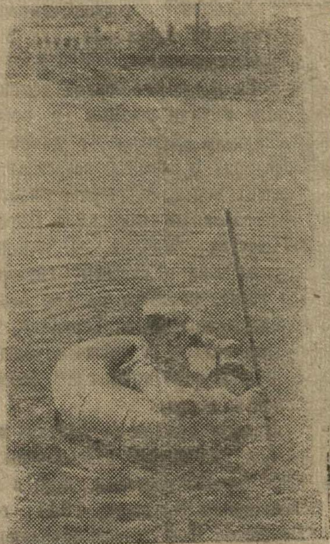
Второй Белорусский фронт.

(Из призывов ЦК ВКП(б) к 27-й годовщине Великой Октябрьской Социалистической Революции).