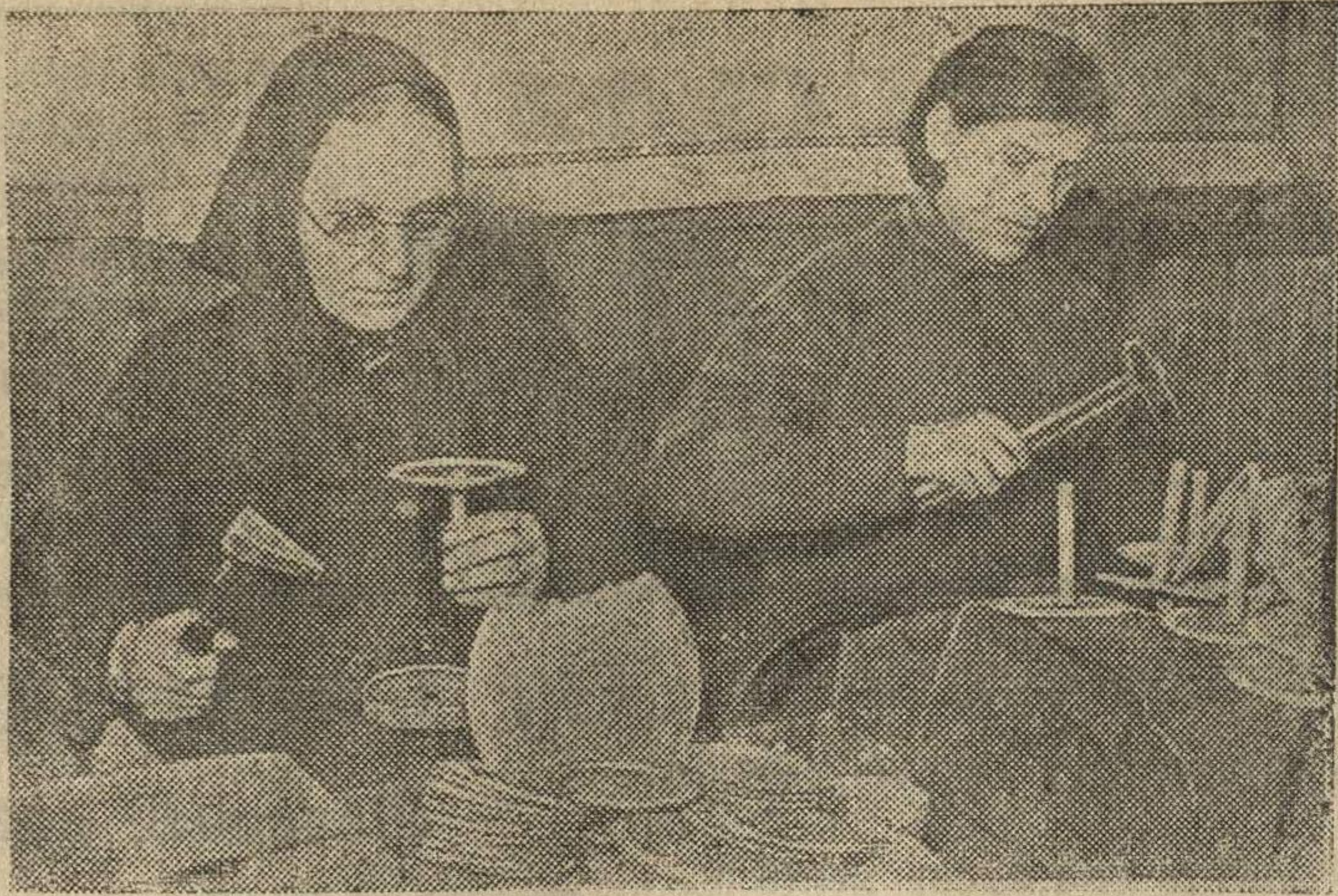
Производство противотанковых гранат на Н-ском заводе в Москве.

Новоусадский военно-учебный пункт начал занятия с допризывниками, подлежащими обучению во вторую очередь всевобуча. Е. Захаров.