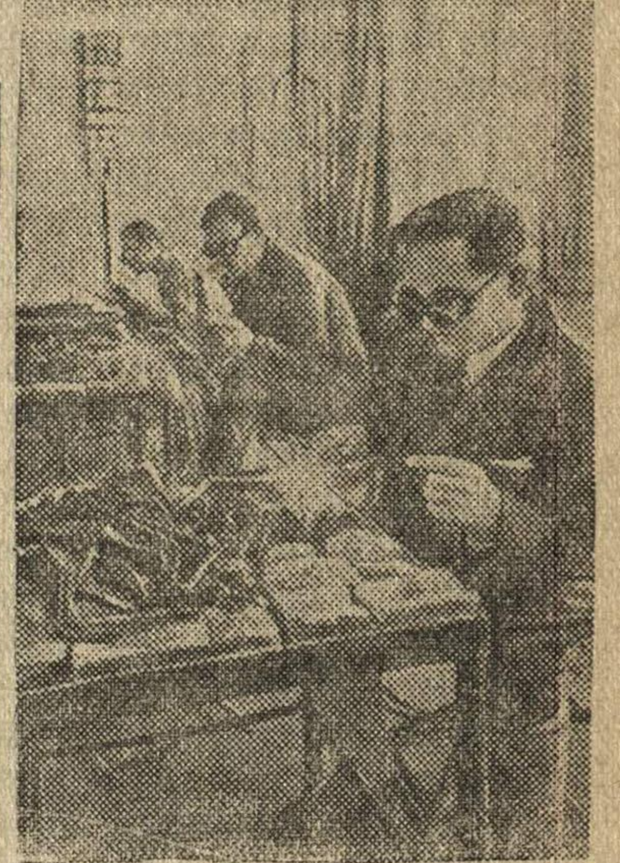
Социалистическое соревнование на предприятиях столицы в честь 24 годовщины Красной Армии.