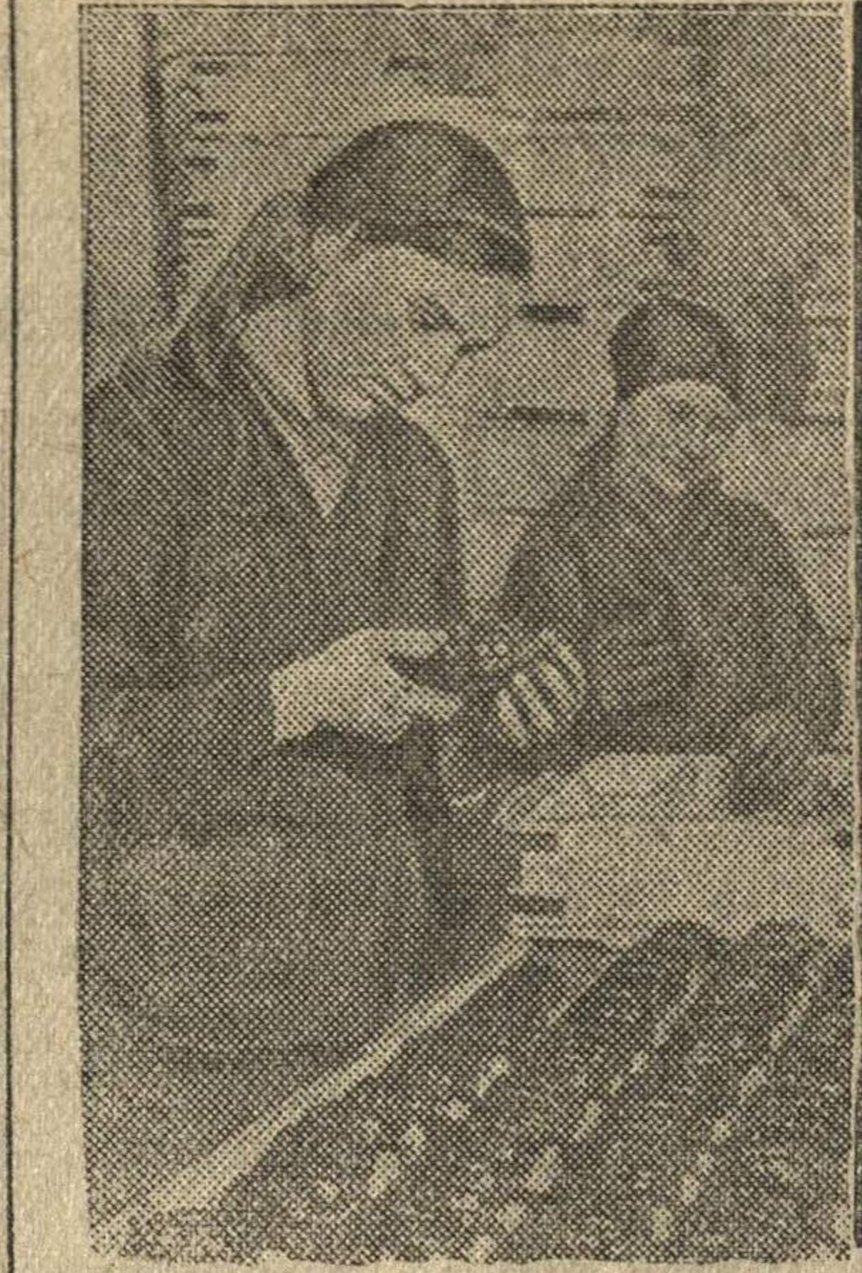
Упаковка ручных гранат на Н-ском заводе (Сибирь).