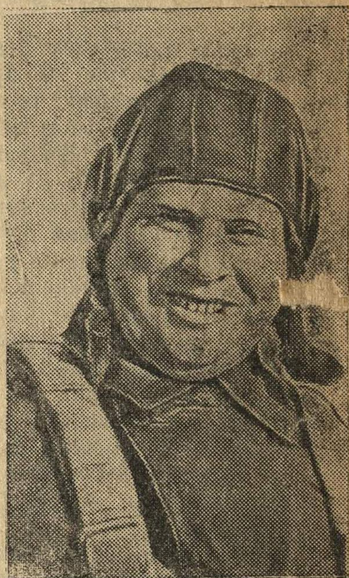
Герой Советского Союза капитан Губрий, награжденный орденом Красного Знамени за героическую оборону Севастополя.