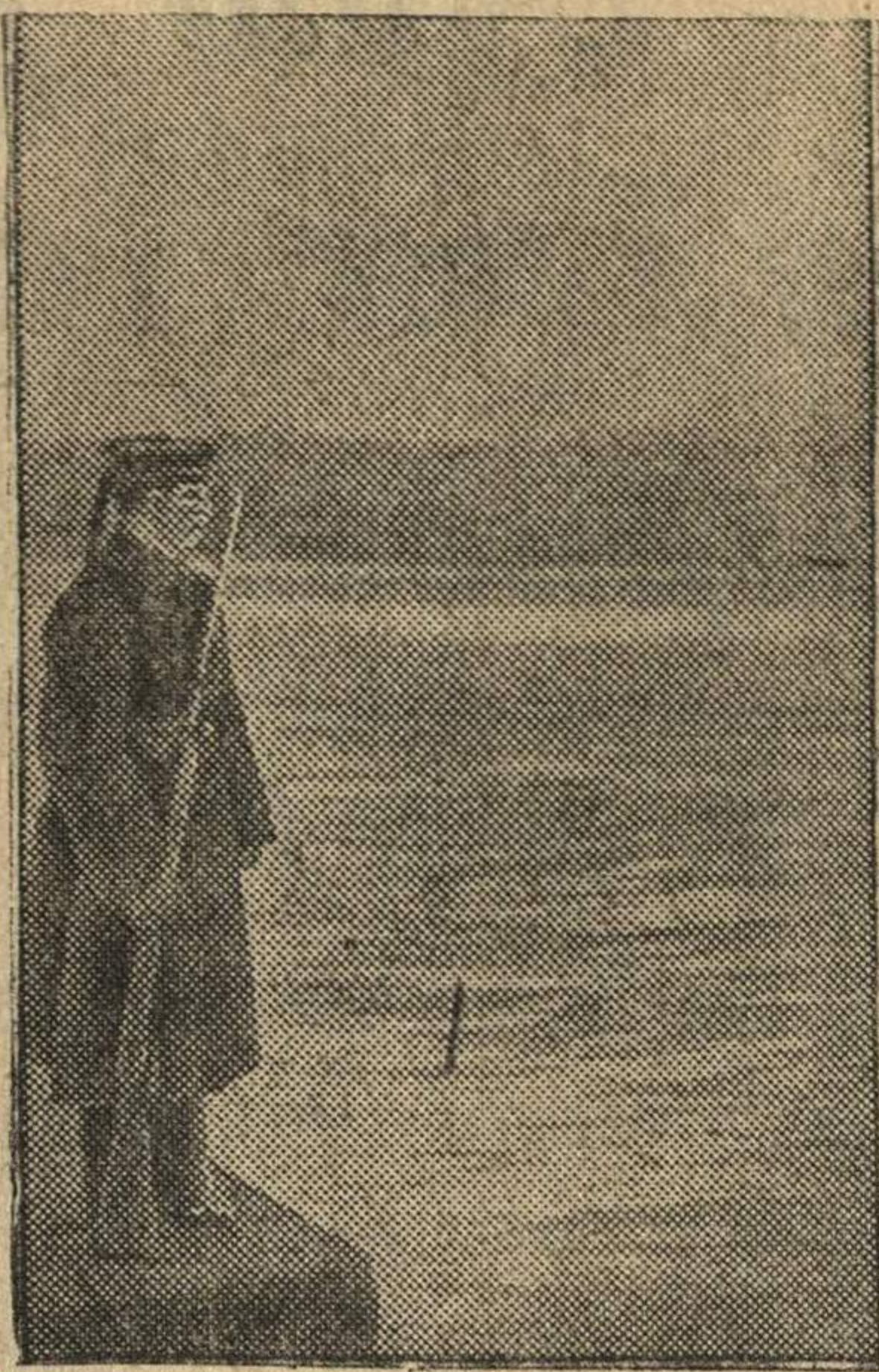
В героическом Севастополе.

* Дезертирство из финской армии принимает все большие размеры. Правительство и командование вынуждены принимать чрезвычайные меры для борьбы с дезертирами. На магистральных и проселочных дорогах патрулируют шюцеровцы. Особые отряды шюцеровцев охотятся за дезертирами, устраивают облавы в городах, селах и на станциях железных дорог. Однако население сочувствует дезертирам и помогает им укрыться от преследования.