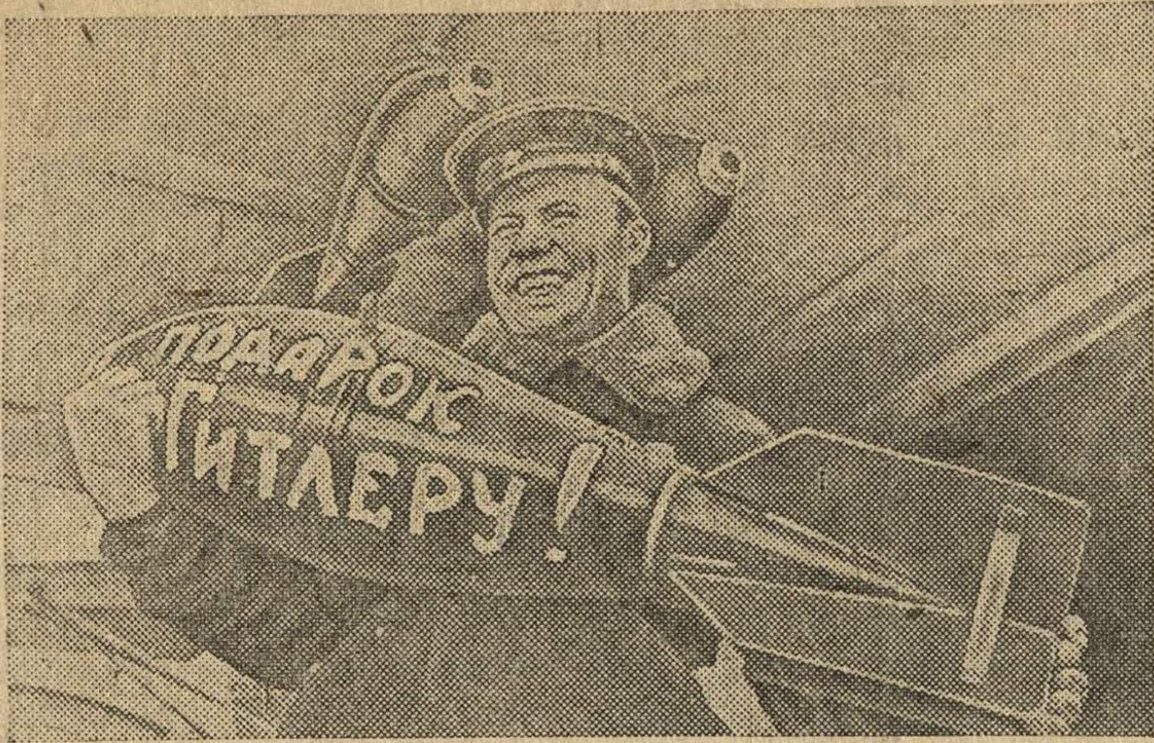
Действующий Черноморский флот.

* Инициатор Всесоюзного соревнования машиностроителей, коллектив станкостроительного завода «Красный пролетарий» добился новых производственных успехов. Во втором квартале завод выпустил сверх плана 137 станков.