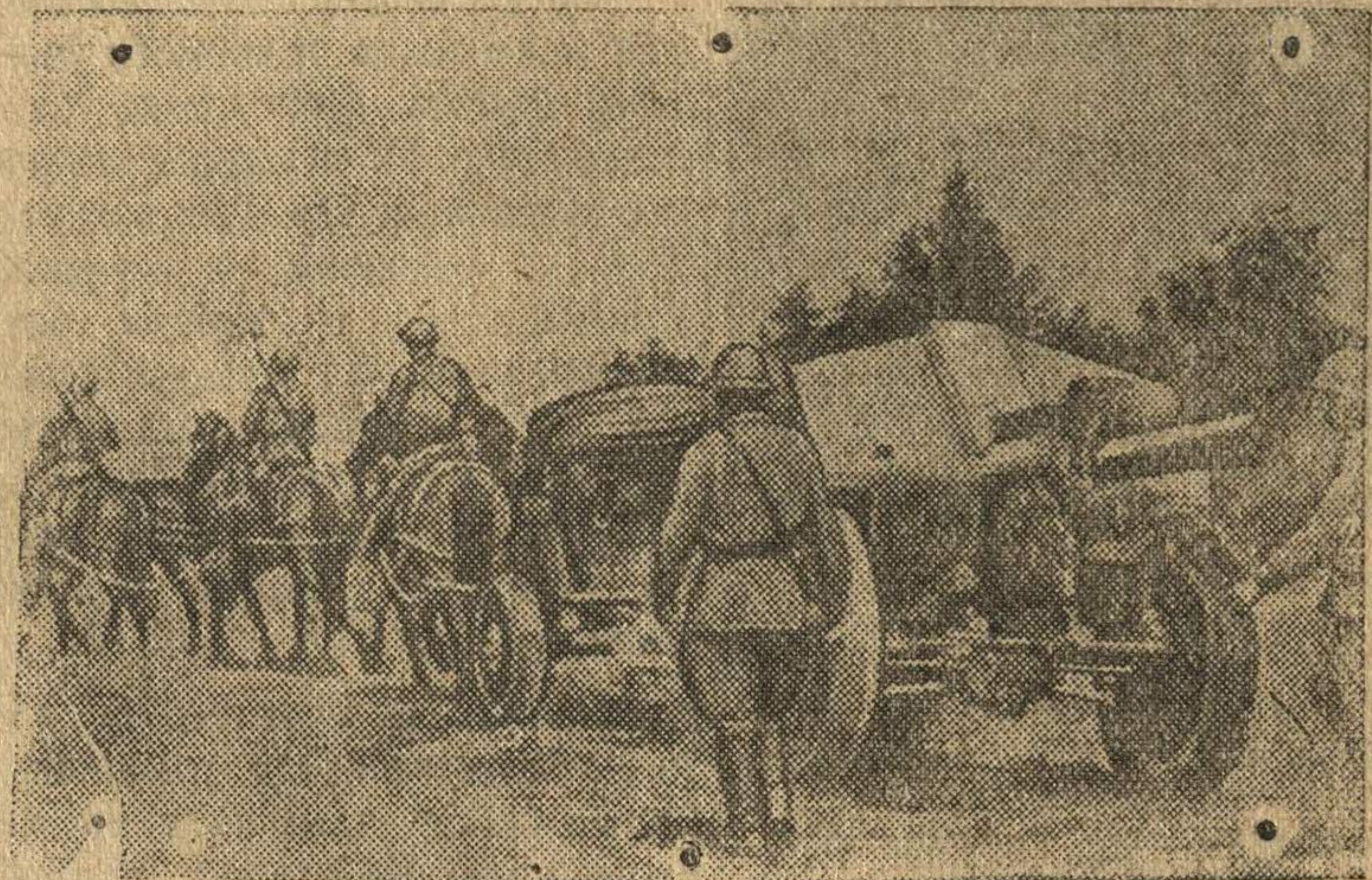
Советские артиллеристы продвигаются на передовые позиции.

Надо усилить темпы уборки картофеля. Каждый день, каждый час хорошей погоды использовать для быстрой уборки этой культуры. Организовать сдачу картофеля на заготовительный пункт прямо с поля.