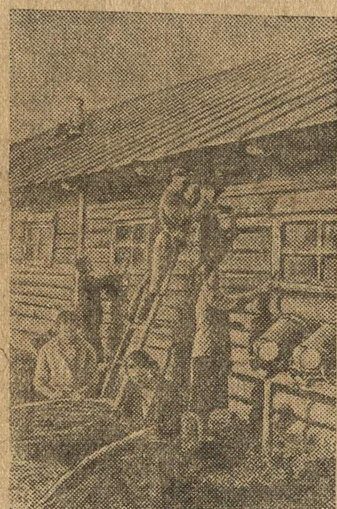
Подготовка теплой зимовки для скота.

На снимке: животноводческая бригада колхоза имени 8 марта (Кохомский район, Ивановская область) заканчивает ремонт скотного двора.