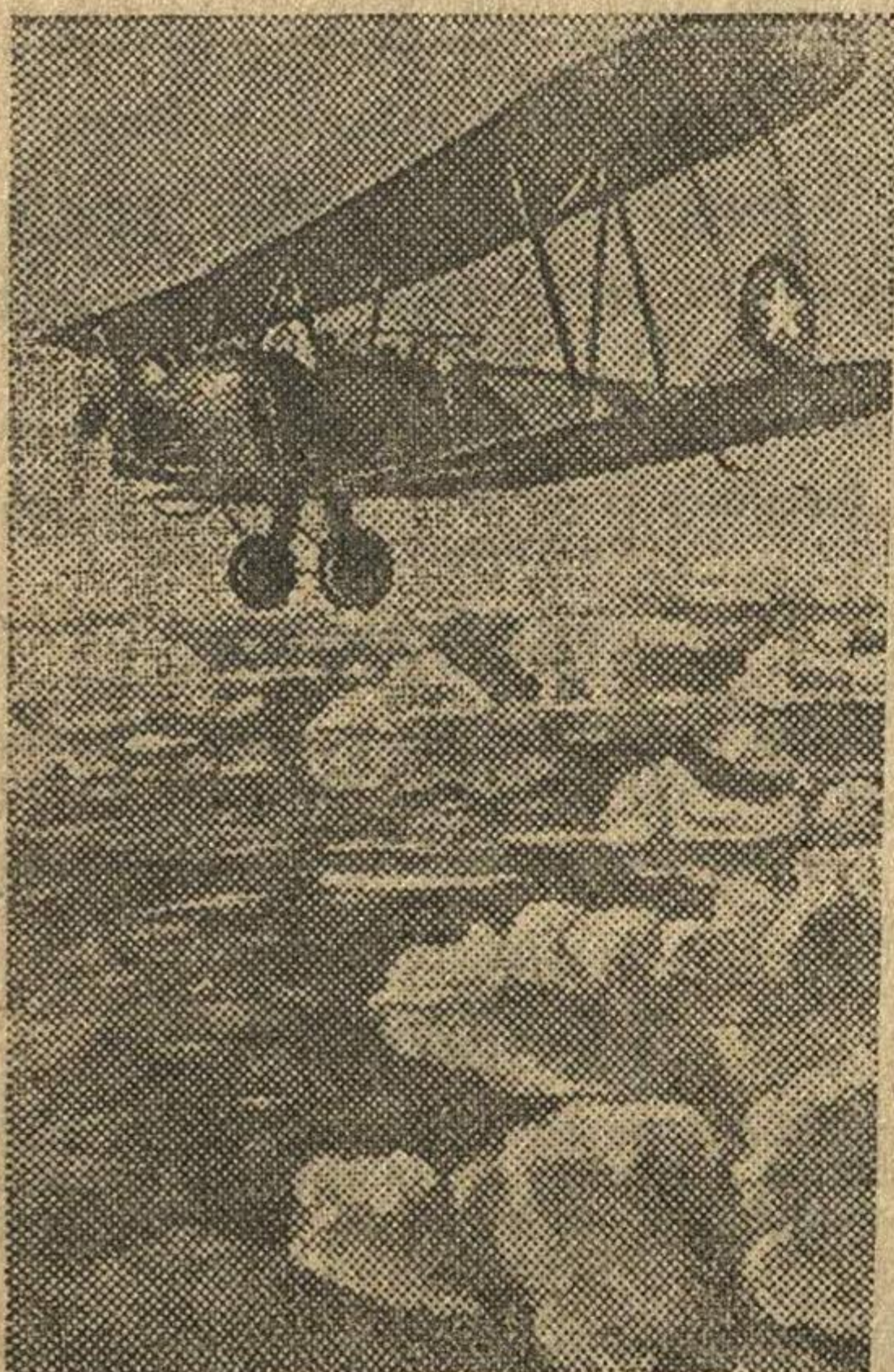
Действующая армия. (Калининский фронт)

Своевременная и отличная подготовка тракторного парка к весенним полевым работам будет большой помощью Красной Армии в ускорении разгрома гитлеровских полчищ.