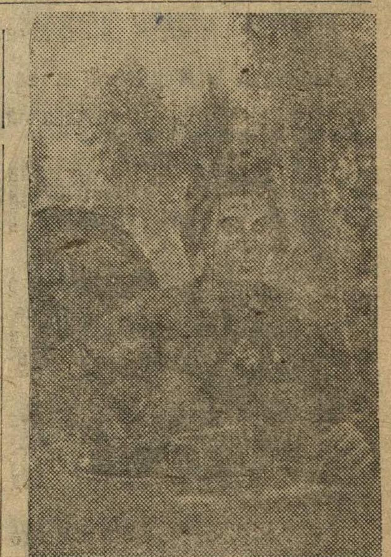
Герой Советского Союза механик водитель танка комсомолец В. А. Григорьев.