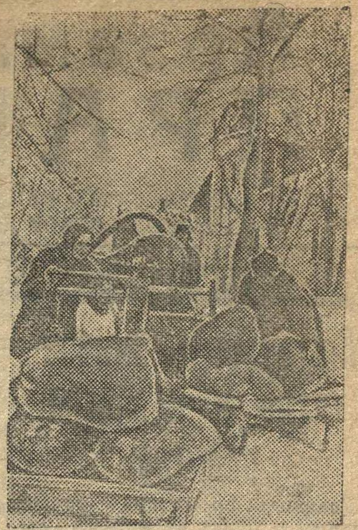
Семена — освобожденным районам

Ивановские колхозники выделили 65 тысяч пудов семян и 1500 голов скота для восстановления колхозного хозяйства Сталинградской области.