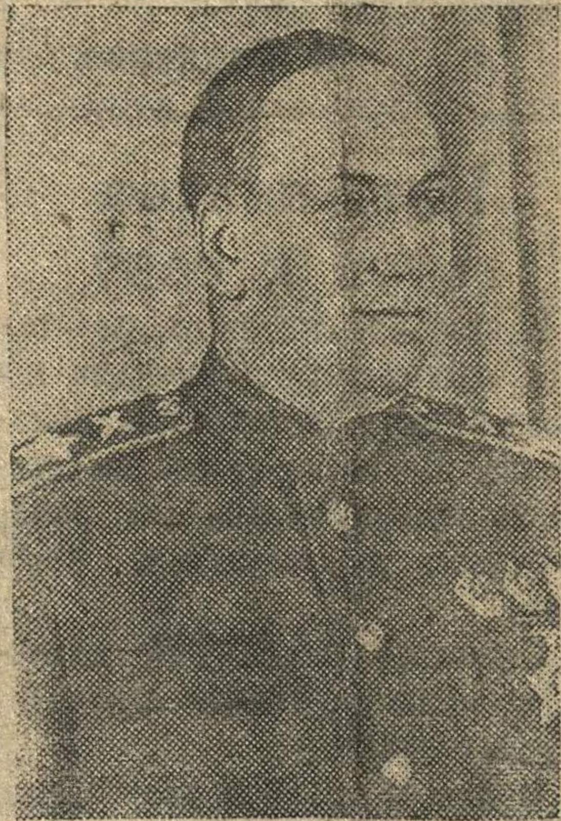
Маршал артиллерии Н. Н. Воронов.