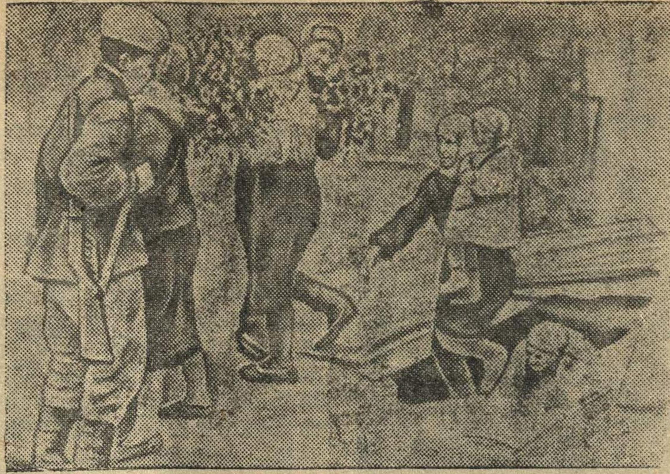
В освобожденной от немецких захватчиков станице Крымской на Кубани.

На снимке: жители станицы, прятавшиеся от немцев в подвалах, радостно встречают своих освободителей.