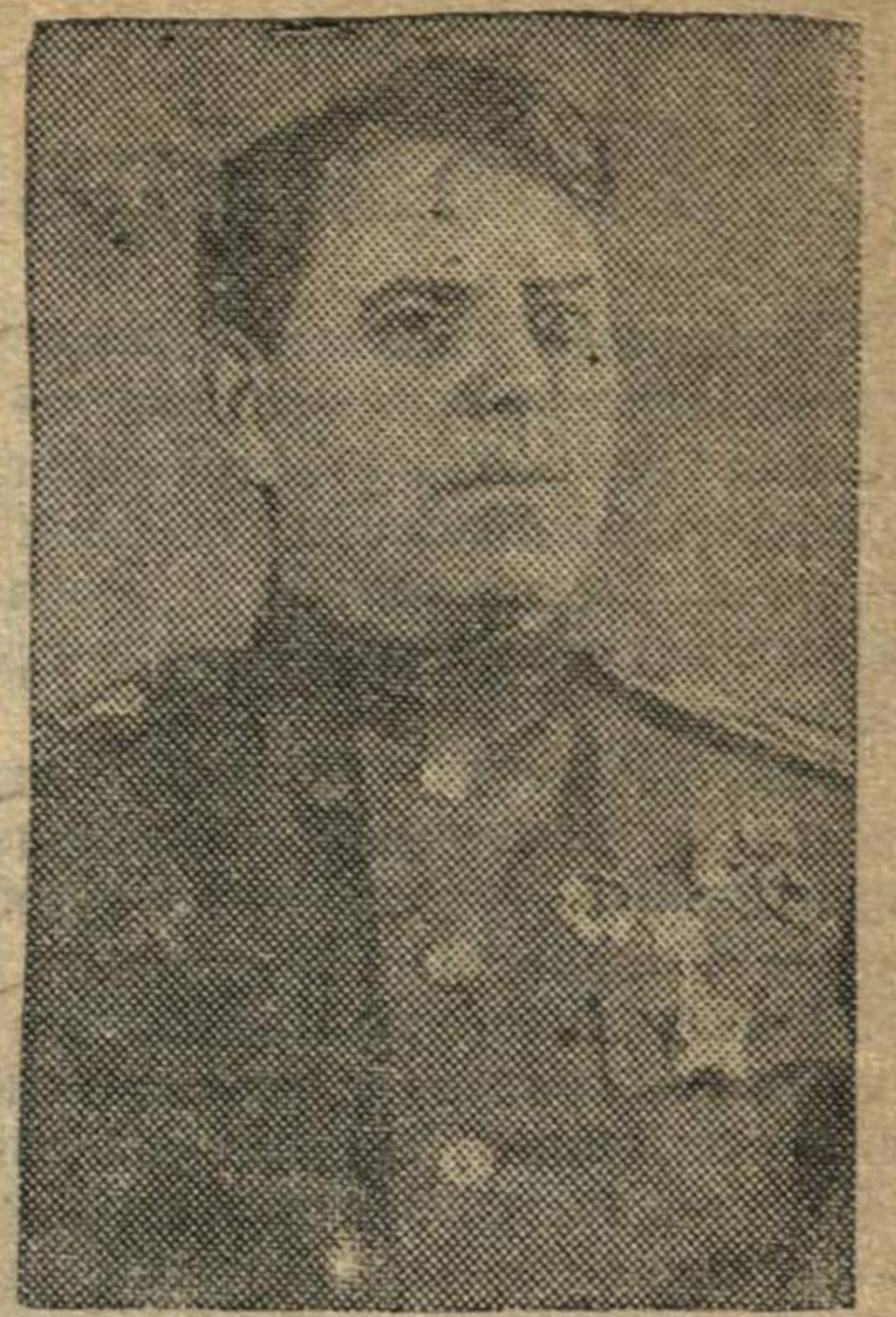
Маршал Советского Союза А. М. Василевский.

* Французские патриоты наносят немецким захватчикам непрерывные удары. В Тулоне вольтные стрелки сожгли 7 цистерн с нефтью. В окрестностях Лиона французы взорвали водонапорную башню. На военном заводе в Гренобле патриоты вывели из строя 4 трансформатора. В Верхней Савойе за один месяц зарегистрированы 122 акта саботажа на заводах и электростанциях.