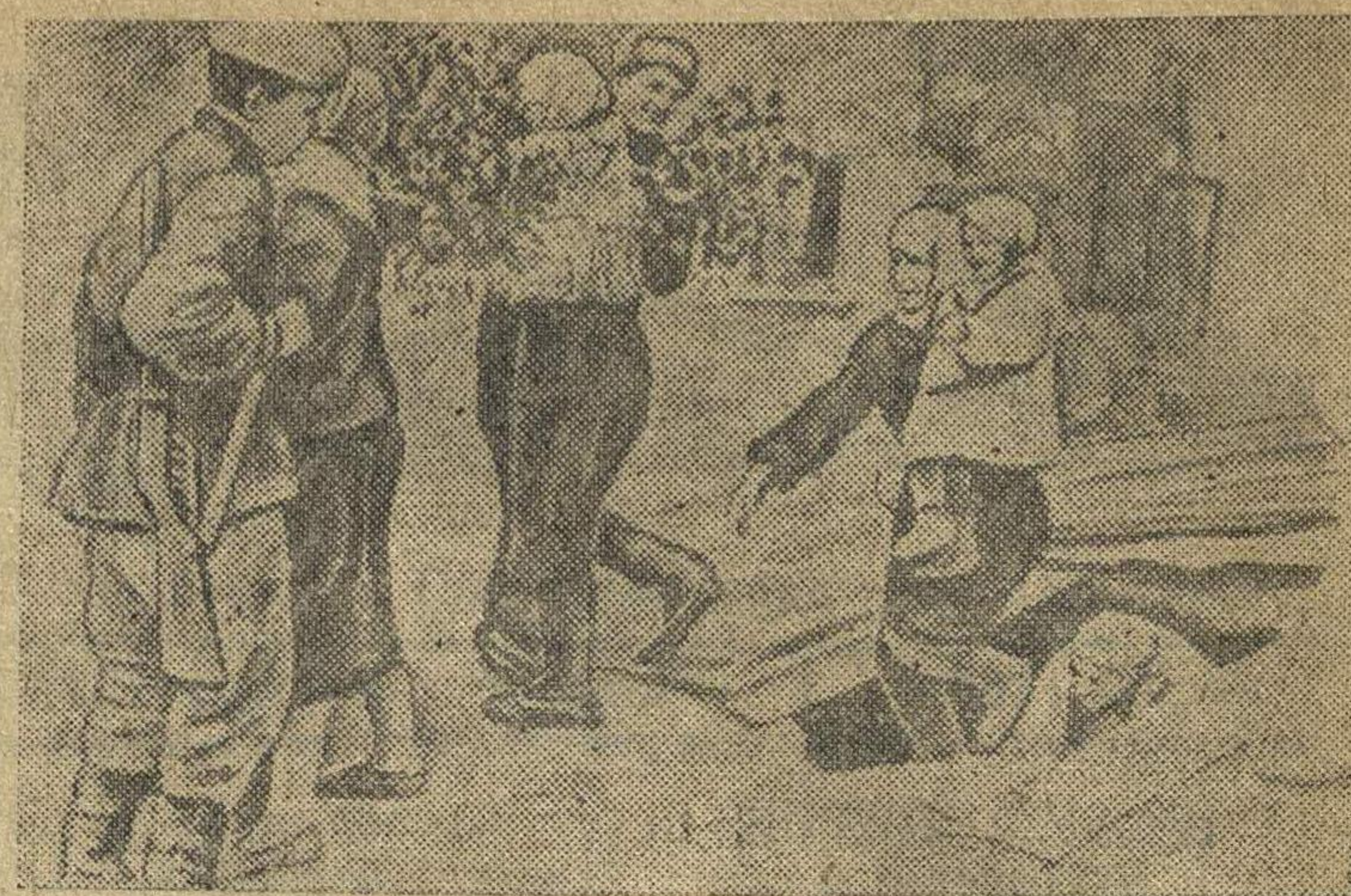
В освобожденной от немецких захватчиков станции Крымской на Кубани. На снимке: Жители станции, прятавшиеся от немцев в подвалах, радостно встречают своих освободителей.

По обсужденному вопросу собрание районного партийного актива вынесло развернутое решение направленное на практическое осуществление задач выдвинутых в первомайском приказе товарищем Сталиным.