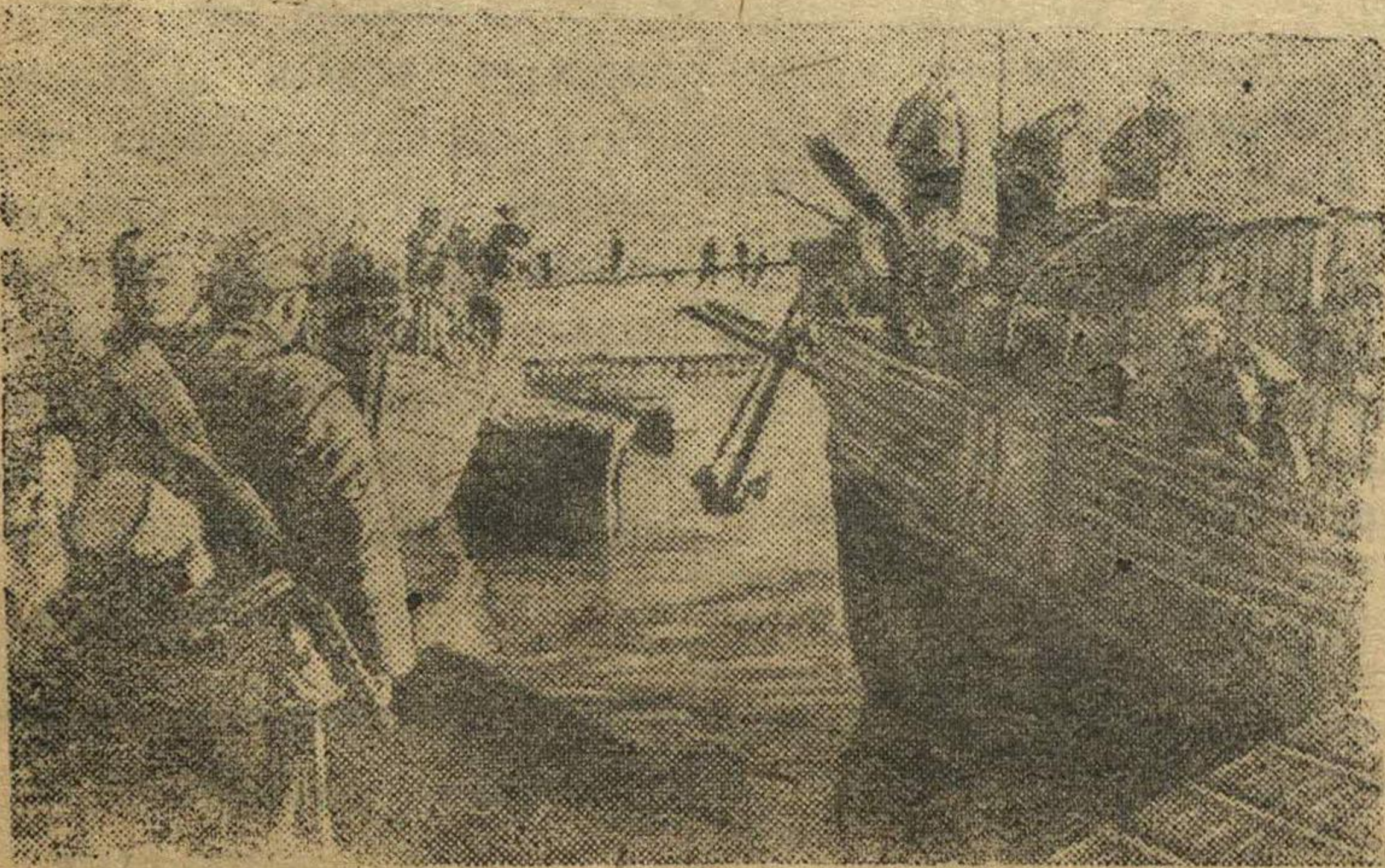
На снимке: Подразделение десантников перед отплытием на боевое задание.