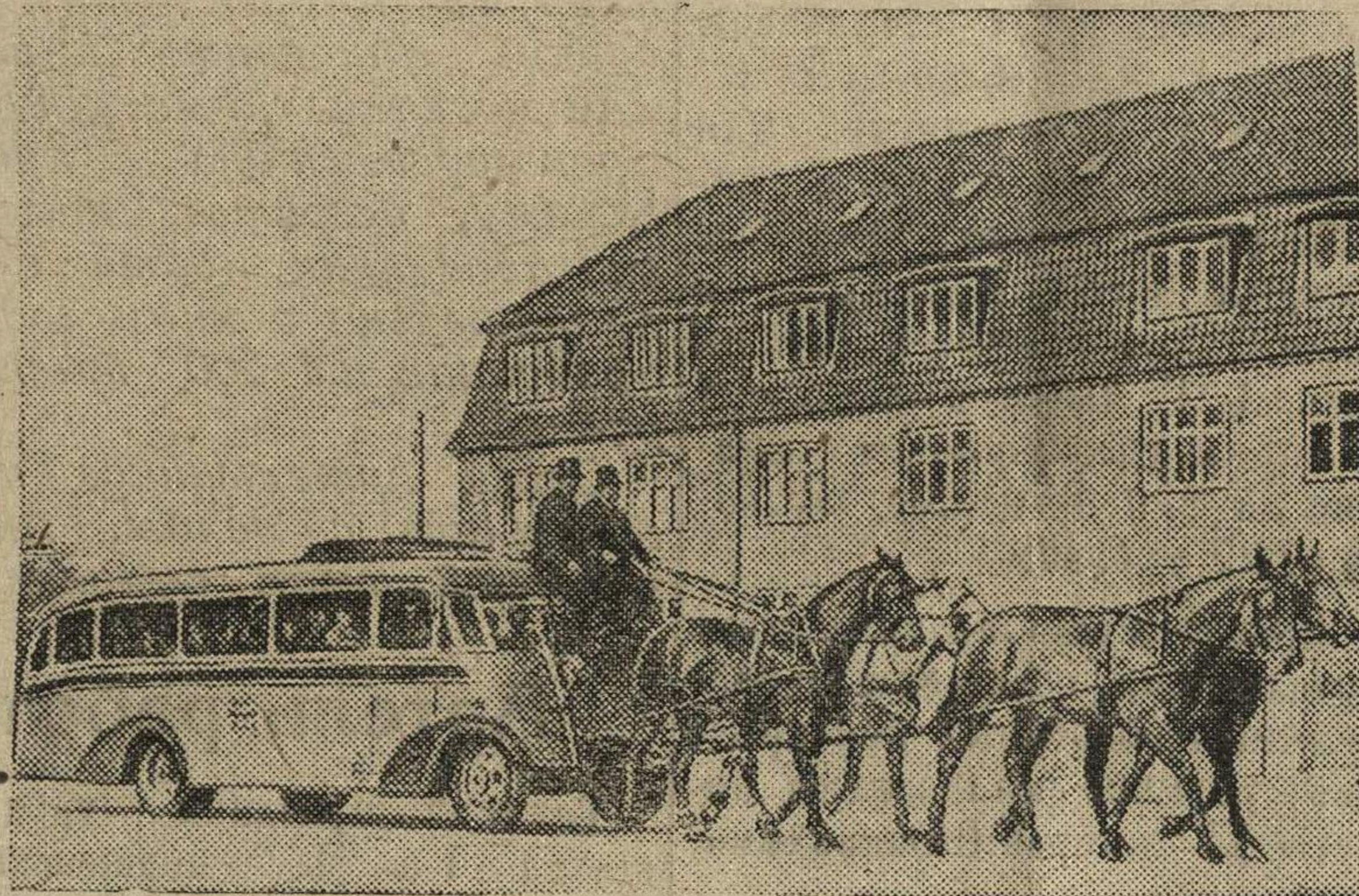
Автобус, превращенный в дилижанс на улице Копенгагена.

В Дании из-за недостатка бензина прибегают к конной тяге.