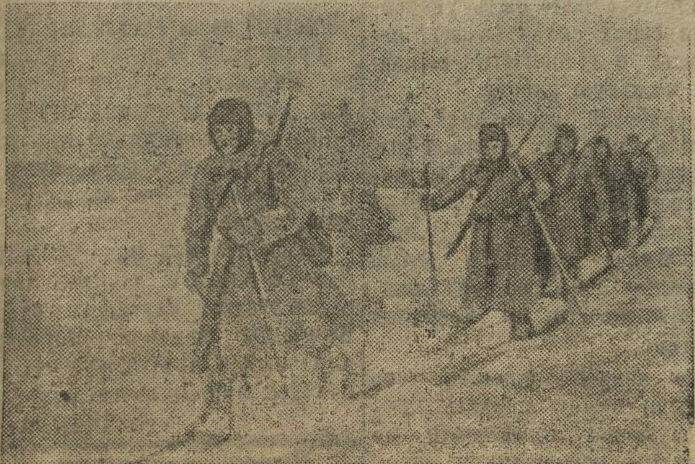
Разведчики-лыжники Н-ской части отправляются на выполнение боевого задания.

В освобожденной от фашистских захватчиков Керчи.