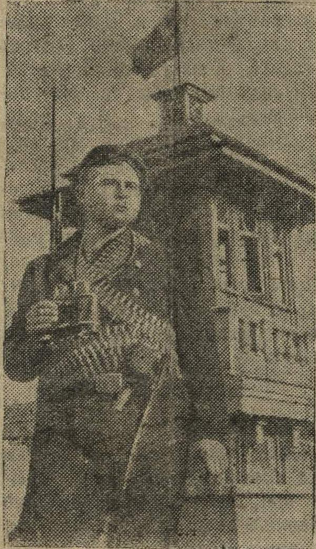
Краснофлотский пост воздушного наблюдения на крыше одного из домов.

В освобожденной от фашистских захватчиков Керчи.