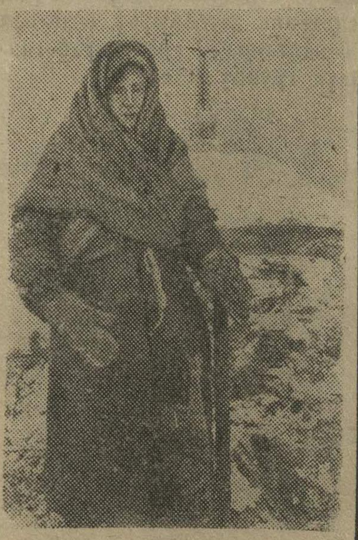
Колхозница деревни Бородинские Горки Строганова на пелище родного дома.

Немцы при своем отступлении из Бородино сожгли деревни Бородино и Бородинские Горки: