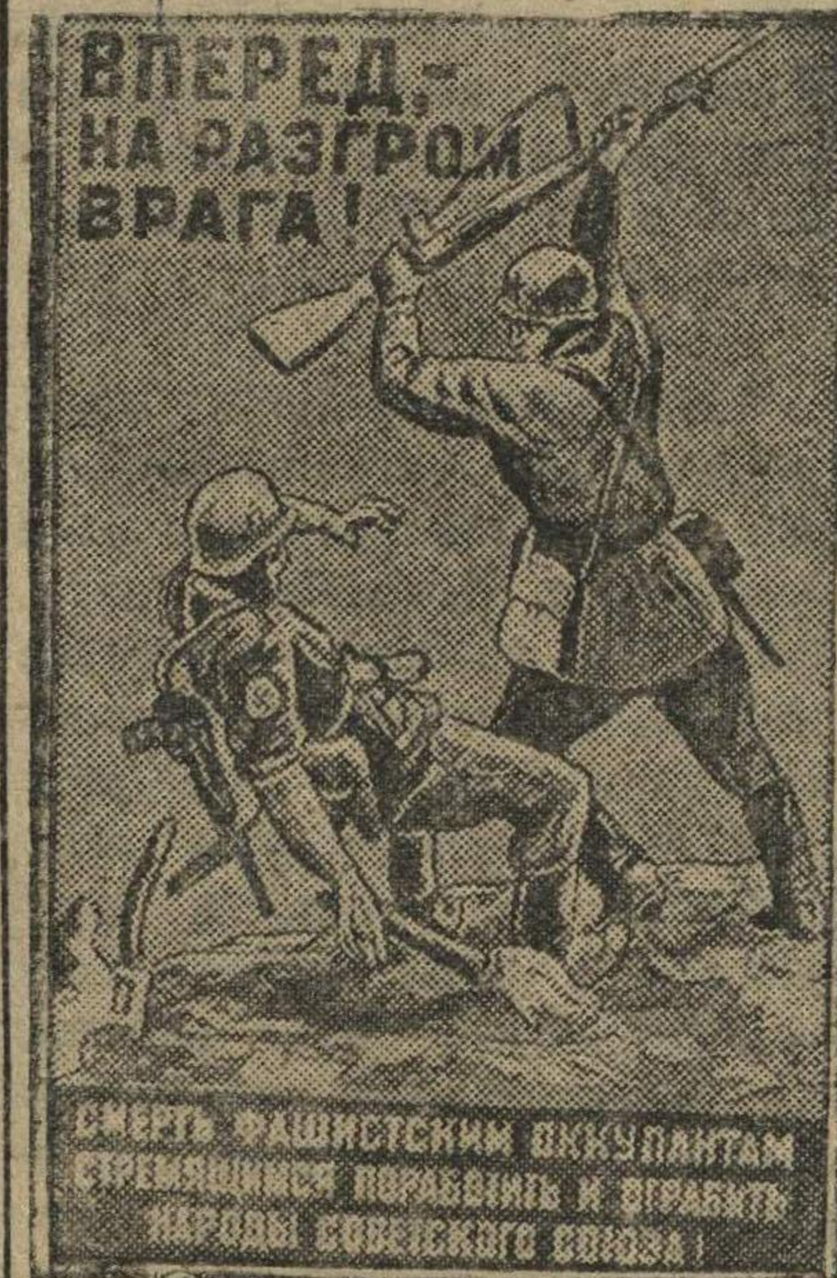
Плакат работы художника Д. Шмарина, выпущенный издательством «Искусство».