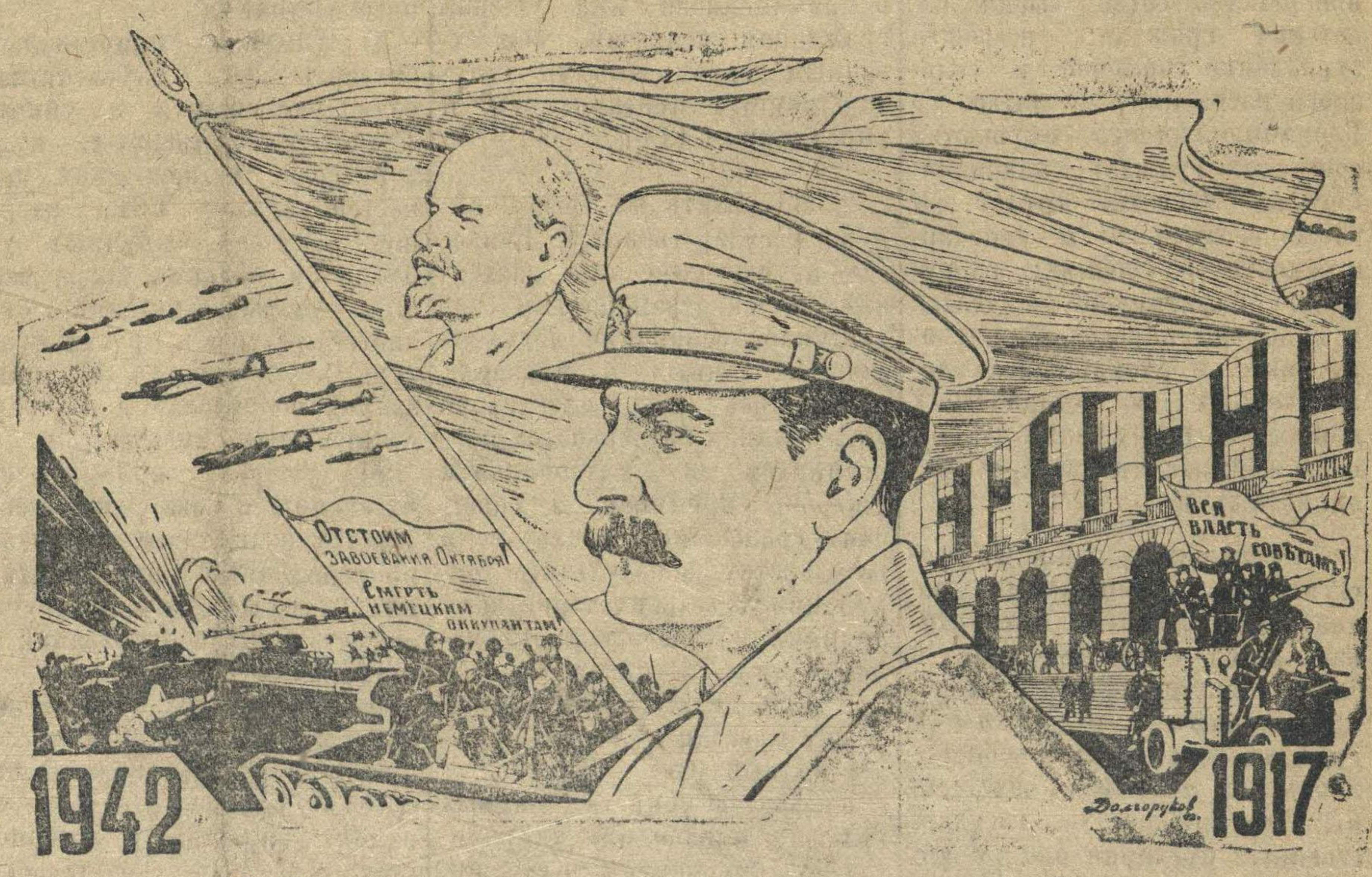
Рисунок худ. Н. А. Долгорукова

Более 16 месяцев длится упорная кровавая борьба. Много зла причинил нам гнусный и подлый враг. Он глубоко проник на нашу территорию, временно отторг от нас богатейшие земли. Враг ограбил, разорил сжиг сотни наших замечательных городов, тысячи