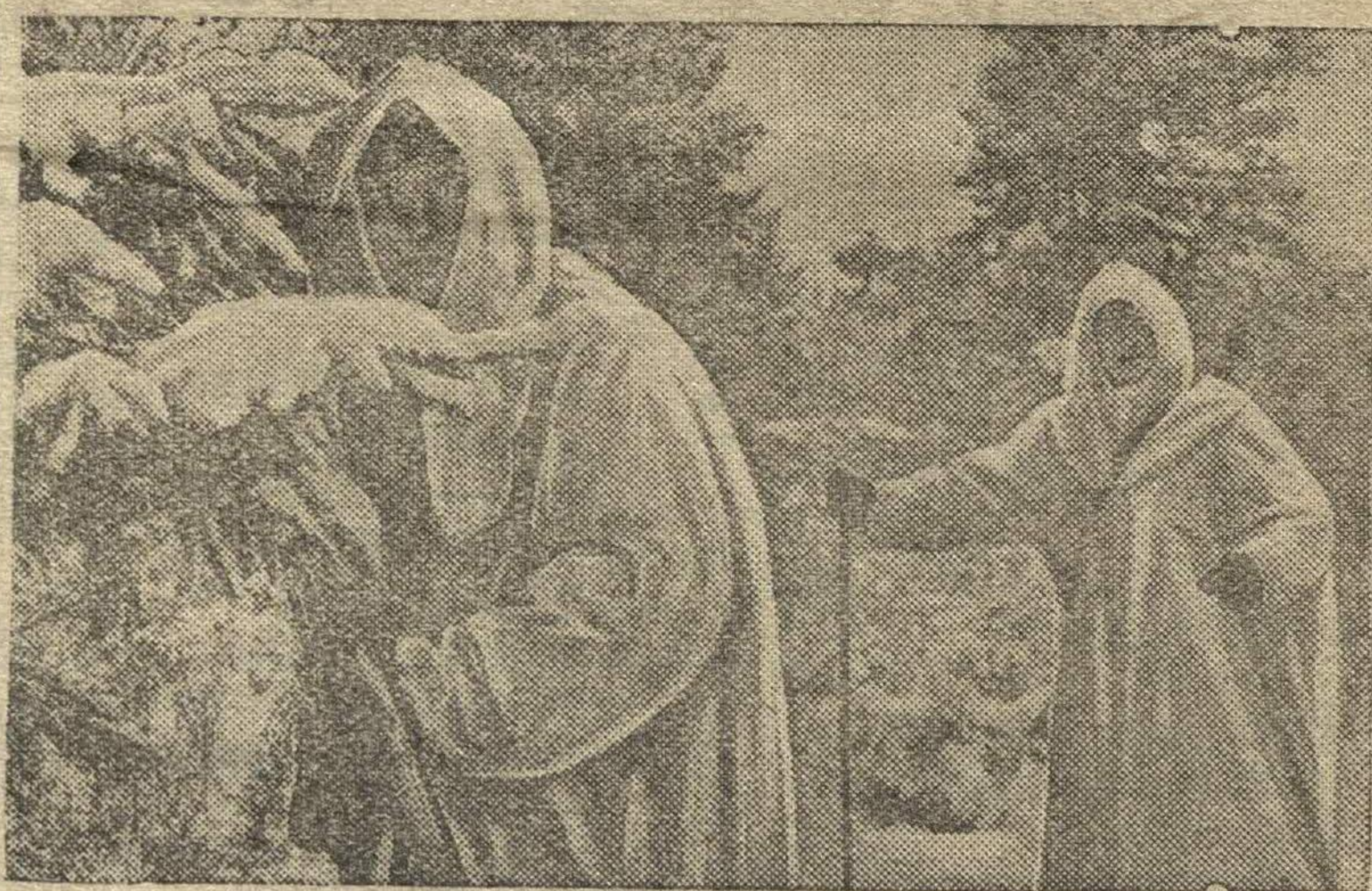
В лыжной разведке. (Н-ская часть Ленинградского военного округа).

В городах, местечках и селах Бессарабии, Левобережья Днестра заканчиваются приготовления к выборам в Верховный Совет СССР и Верховный Совет Молдавии. Приведены в порядок помещения, подготовлены урны, избирательные бюллетени. На улицах, в учреждениях и общественных местах расклеены плакаты с портретами и краткими биографиями кандидатов в депутаты. В одном лишь Кишиневском уезде выпу-