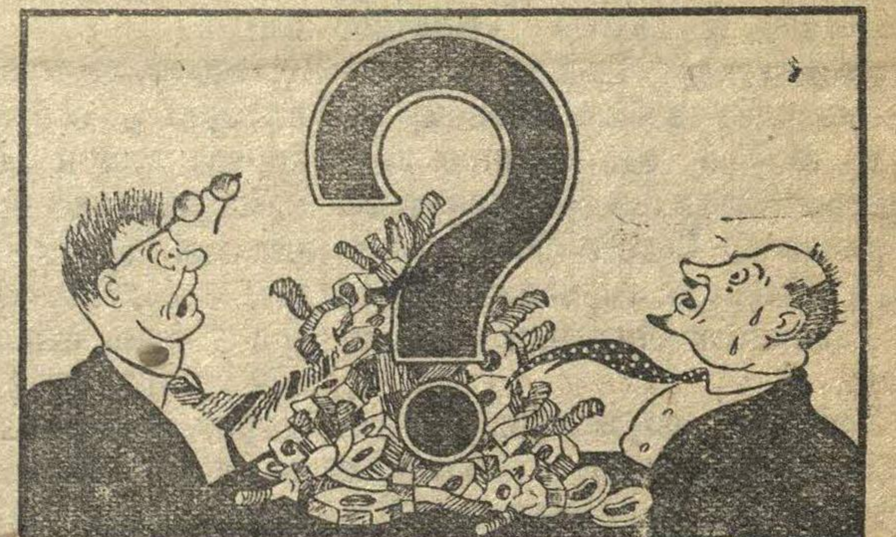
Пока изучали, выросло и брак и вопрос о браке.