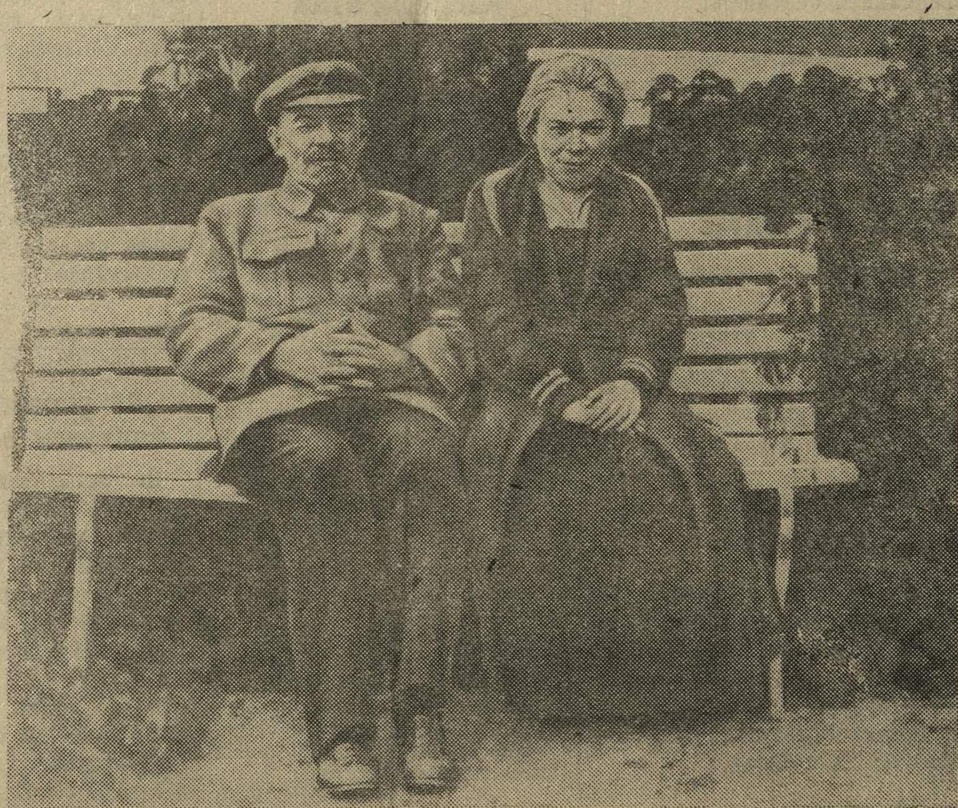
На снимке: В. И. Ленин и сестра его М. И. Ульянова в Горках (1922 г.)