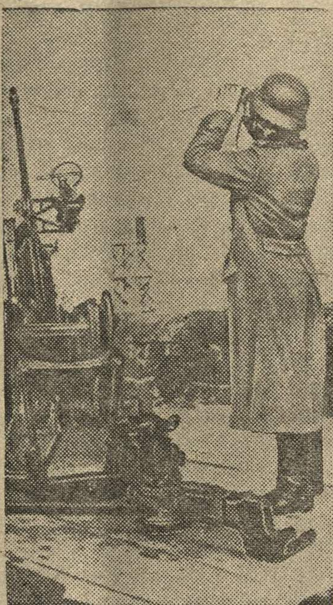
Германское легкое зенитное орудие на бельгийском побережье в районе Остенде.