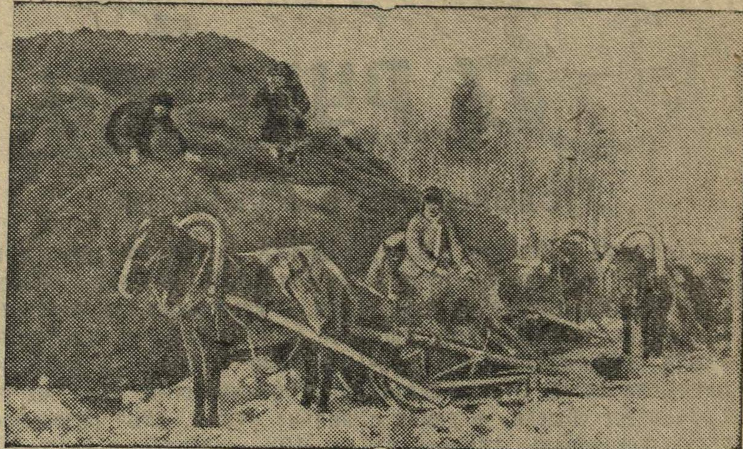
Сдача колхозниками Осташевского района льнотресты на сырьевой склад Пороховского льнозавода (Волоколамский район, Московская область).